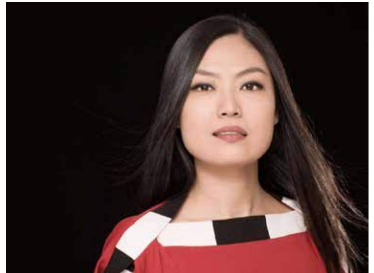
YEJIN GIL: Klavervirtuos fra Korea.