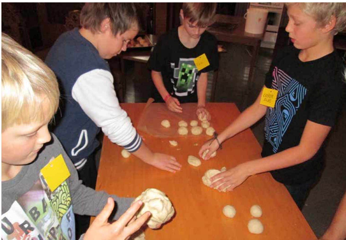
AKTIVE: Gutter i sving på en tidligere aktivitetsdag.