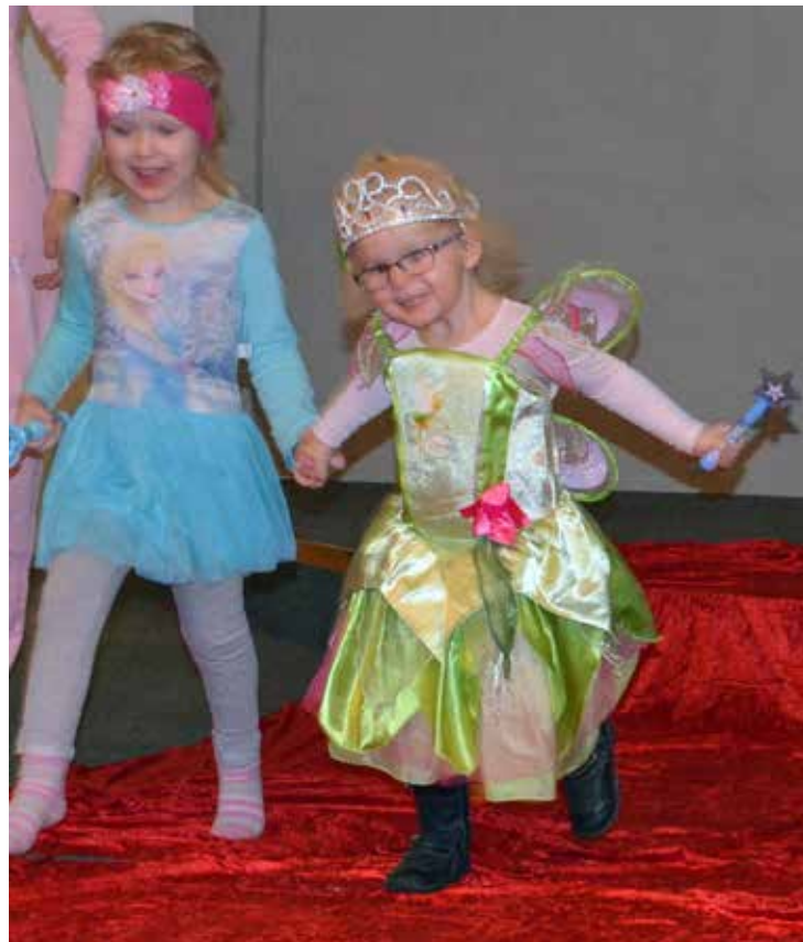
KARNEVAL: To prinsesser på Alfsams karneval i februar.

kekaffen denne dagen, som er søndag 21. oktober.