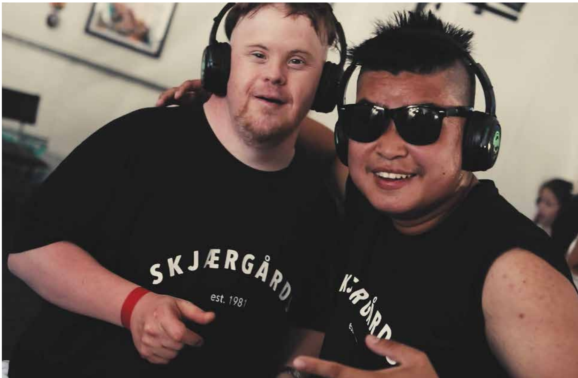
PÅ FESTIVAL: Klubben er med på «Skjærgårds Unik» om sommeren.