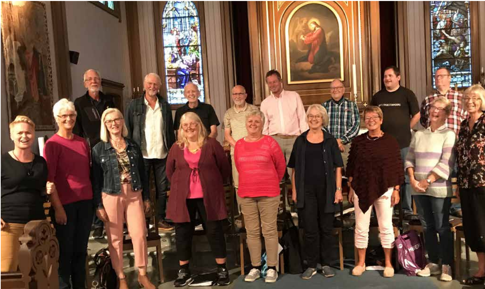
KORØVELSE: Så glad blir en av å synge i kor!