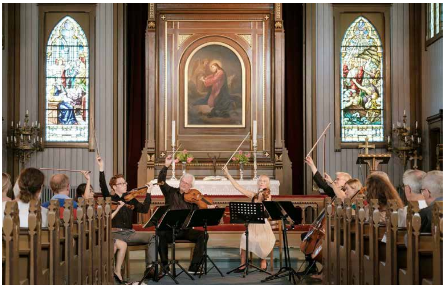
MUSIKKGLEDE: Fra en konsert med de samme musikerne i sommer.