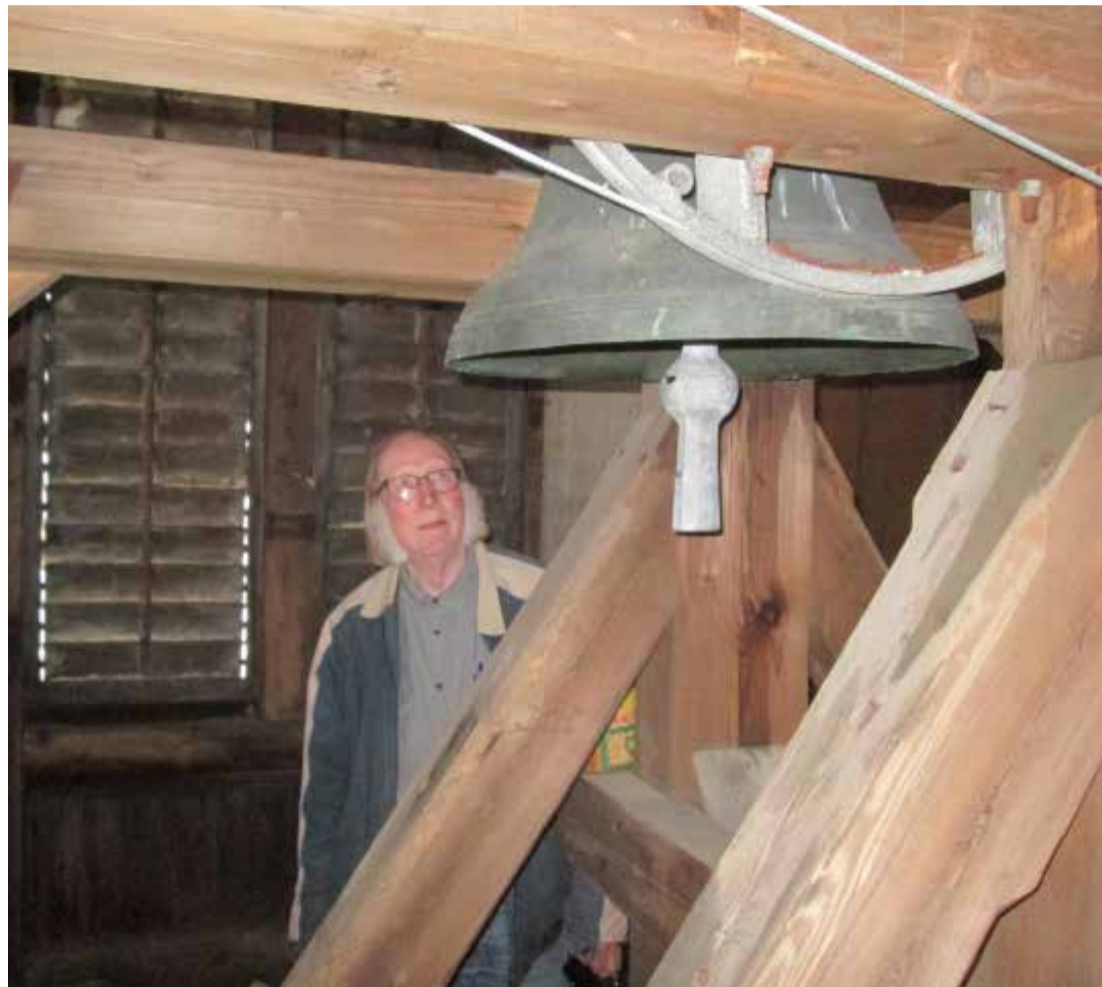
I KIRKETÅRNET: Hit opp skal både «tårnagenter», konfirmanter og gullkonfirmanter.