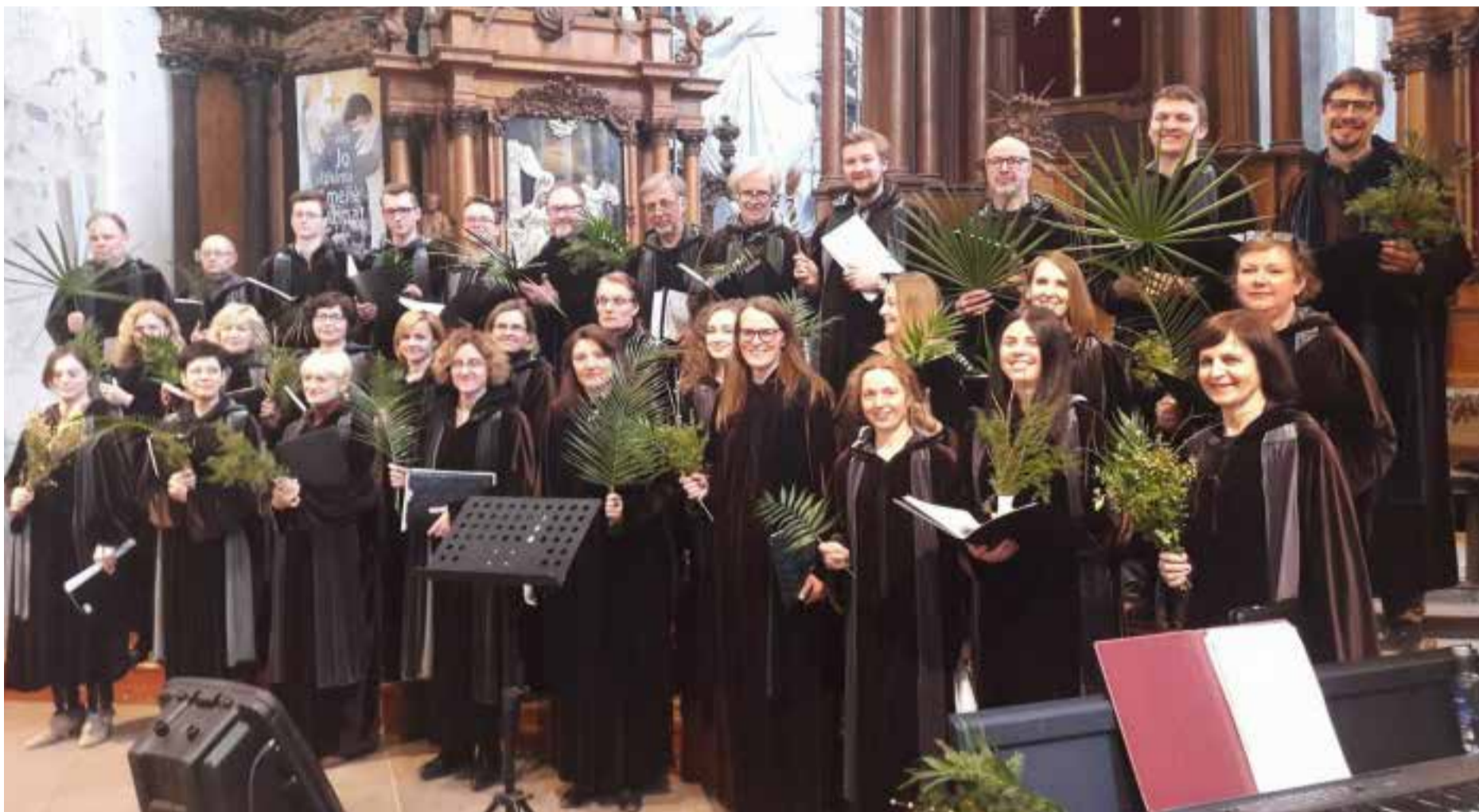
CHORAS LANGAS: Kirkekor fra Vilnius.