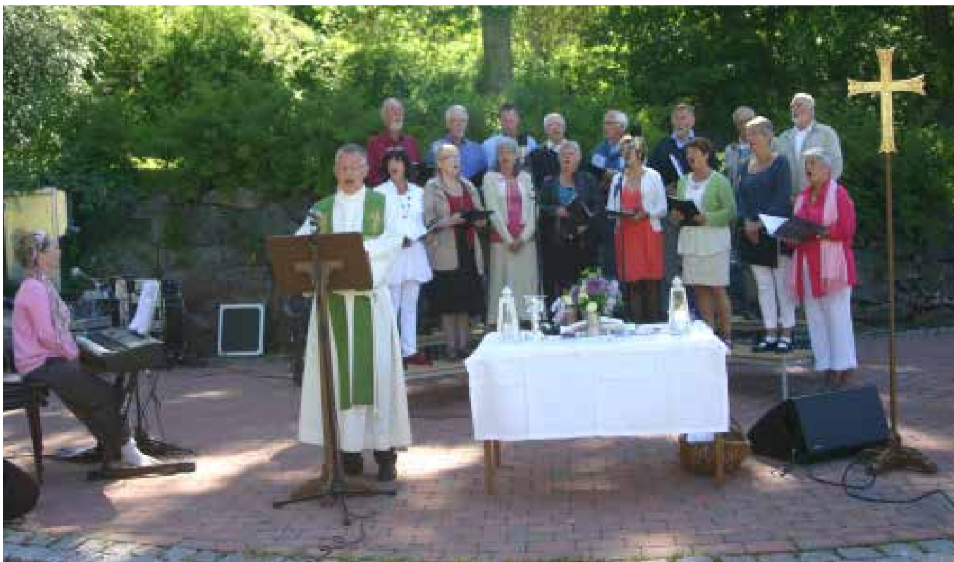
AMFIET PÅ KIRKEHEIA: Kirkecoret er med ved gudstjenesten i morgen.