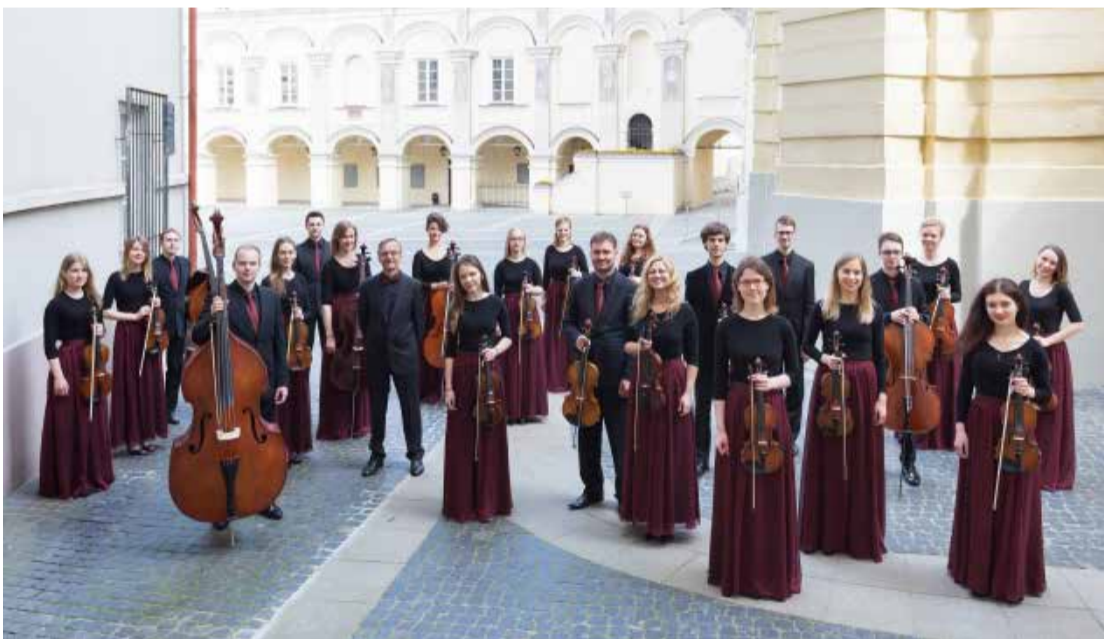
KAMMERORKESTER DELTAR: Hører til universitetet i Vilnius.

► MANDAG 18. juni blir det en sjelden musikkbegivenhet i Grimstad kirke. Da kommer et kor fra to kirker i Vilnius og skal synges sammen med Kristiansand Operakor og Agder Vokalsemble. Dessuten medvirker et kammerorkester fra universitetet i Vilnius.