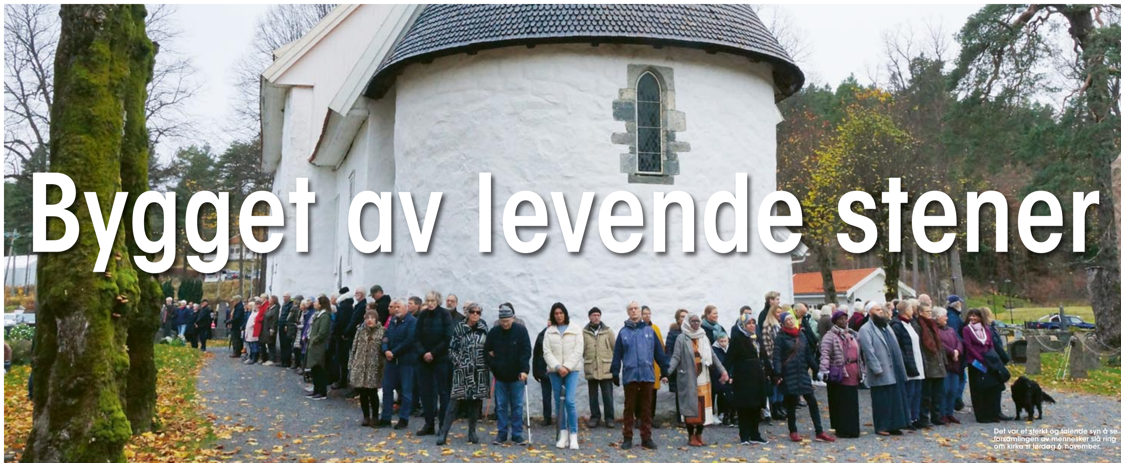
Det var et sterkt og talende syn å se forsamlingen av mennesker slå ring om kirka si lørdag 6. november.

Fredag morgen 29. oktober kom nyheten man nesten ikke ville tro var sann. Fjære kirke var vandalisert innvendig. En eller flere inntrengere hadde i løpet av natten tatt seg inn i kirken og herjet med inventaret og forsøkt å tenne på.