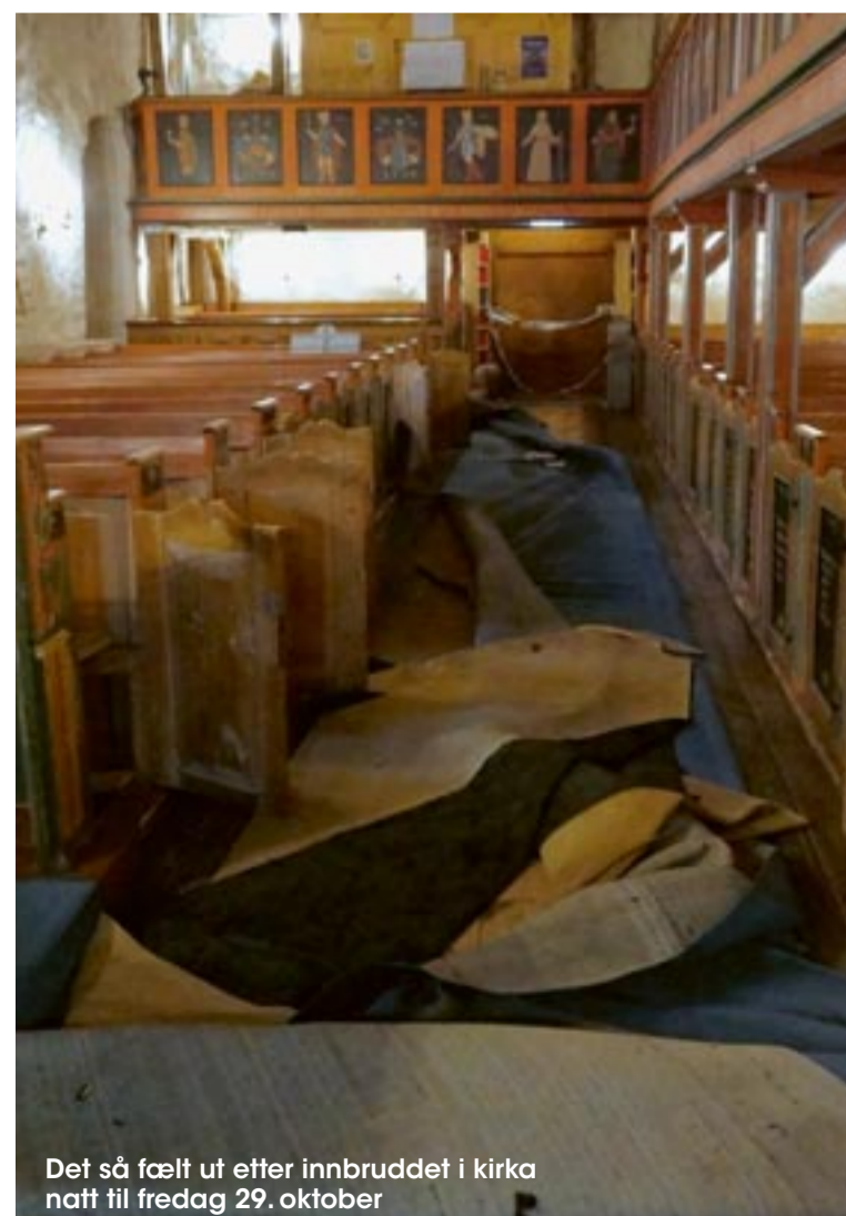
Det så fælt ut etter innbruddet i kirka natt til fredag 29. oktober