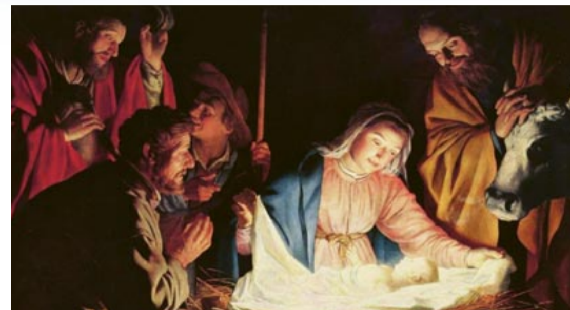
Gerard van Honthorst

I etterkant av gudstjenesten hadde vi en egen samling bare for 4-åringene, der de lærte om da Gud skapte alt, og viktigheten av å ta vare på det Gud har gitt oss.