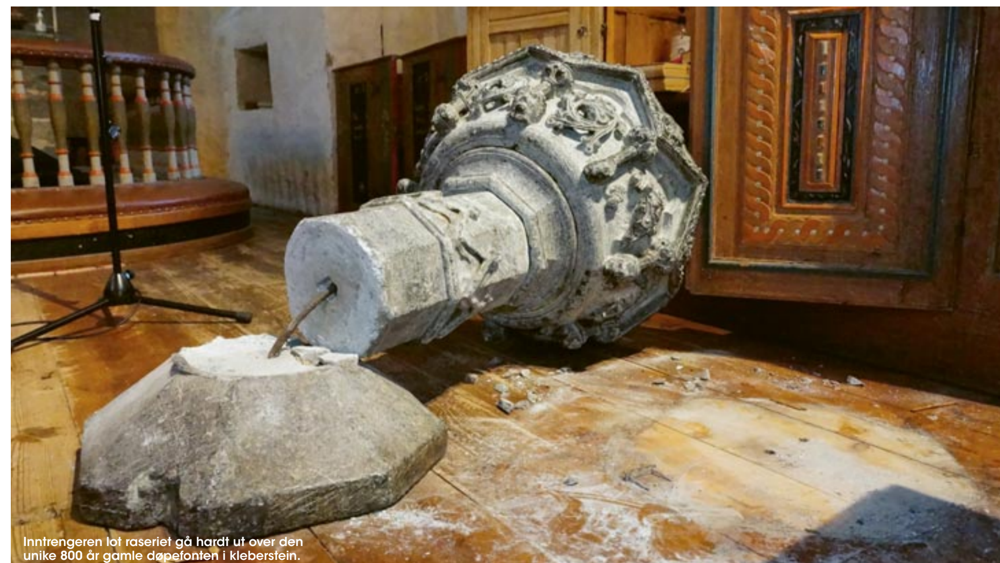
Inntrengeren lot raseriet gå hardt ut over den unike 800 år gamle døpefonten i kleberstein.