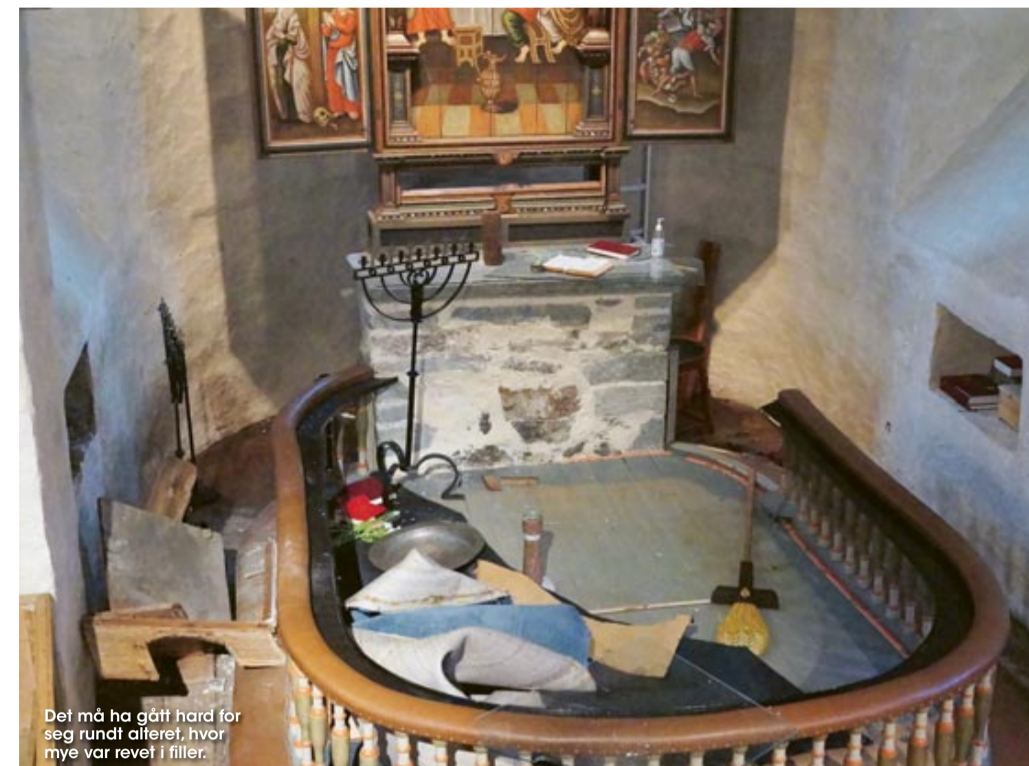
Det må ha gått hardt for seg rundt alteret, hvor mye var revet i filler.