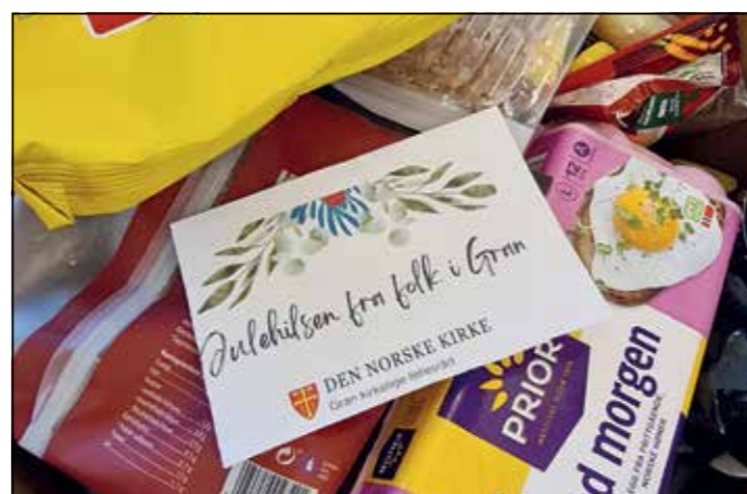
Fra matutleveringen før jul i 2023.

Pengene du gir går til innkjøp av mat og julegodt til noen som trenger det. Alle bidrag, små eller store, hjelper!