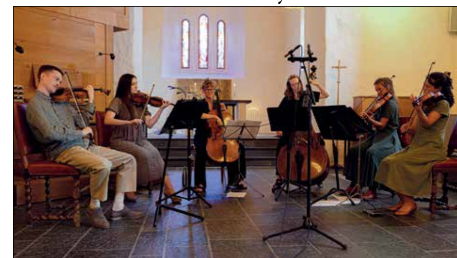
Hadeland Strykeensemble 2024.