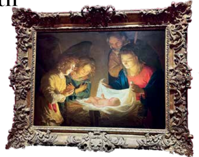
Adoration of the Child av Gerrit van Honthorst av fotografert fra Uffizigalleriet i Firenze.

Ordet skapte lyset i skapelsens morgen. Gud sa: «Det bli lys.» Og det ble lys! Dette Ordet fødes på ny og blir lys som lyser i mørket, ja, som lyser for hvert menneske. På denne måten åpner Johannes sitt evangelium. I kunsten kommer dette til uttrykk i malerier av Jesu fødsel. Det finnes ikke noe lys i stallen. Men lyset i maleriet stråler ut fra barnet. Og det er dette lyset som kaster lys på alle de andre i stallen. På stolte og slitne foreldre. På fattige og litt forskremte gjeterne. På dyr og detaljer i rommet. Det lyser på alt det skapte, og skaper ny virkelighet. Dette er kunstens tolkning av virkeligheten som skapes i Jesu fødsel og i Guds komme til verden. «Det som ble til i ham, var liv, og livet var menneskenes lys. Lyset skinner i mørket, og mørket har ikke overvunnet det.»