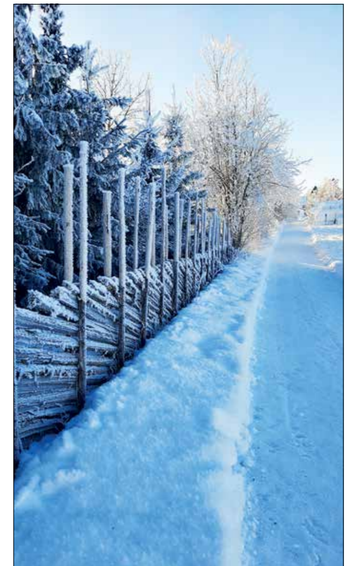
En kald vinterdag på stien bak Granhøi på veg opp mot Sanne skole.

Trivsel er viktig også utenom høytidene, og fellesrommene har et hjemmekoselig preg. På Granhøi legges det vekt på sosialt samspill ved måltidene. Beboerne får servert 3-retters middag hver dag. Det er trim hver uke og utearealene blir stadig brukt. Innendørs er det trivelig å sysle med bingo. Omreisende trubadurer kommer og underholder en gang imellom. Det er allsang andre tirsdag i måneden. Kirken i Gran holder andakter den tredje tirsdagen i måneden.