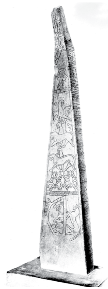
Kopi av Dynnasteinen som står på Hadeland Folkemuseum.

Her i Gran kan vi skilte med den eldste, kjente framstillingen av juleevangeliet i norsk historie. Den snart tusen år gamle Dynnasteinen med sine runer og utskjæringer framstiller juleevangeliet i sine enkle streker – stjernen, Jesusbarnet, de tre vise menn til hest og gaveoverrekkelsen i stallen.