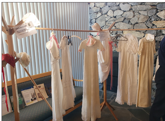
Mange hadde med seg dåpskjoler og luer