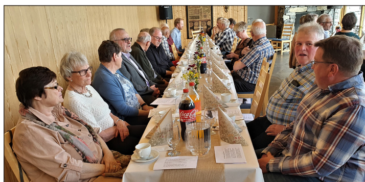
Deltakerne samlet ved vakkert pyntede bord for å innta gryterett med tilbehør