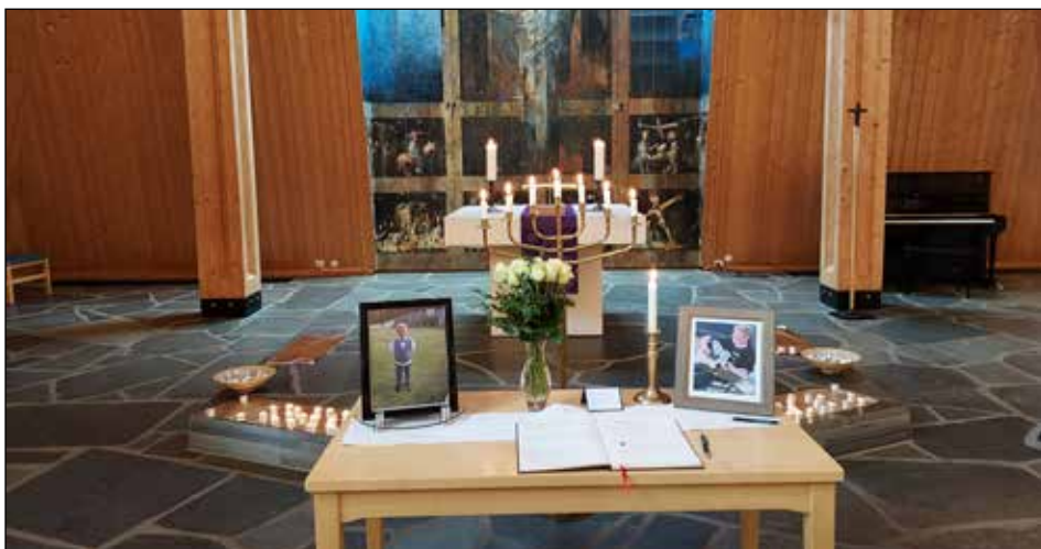
Mange skrev en hilsen i minneboka