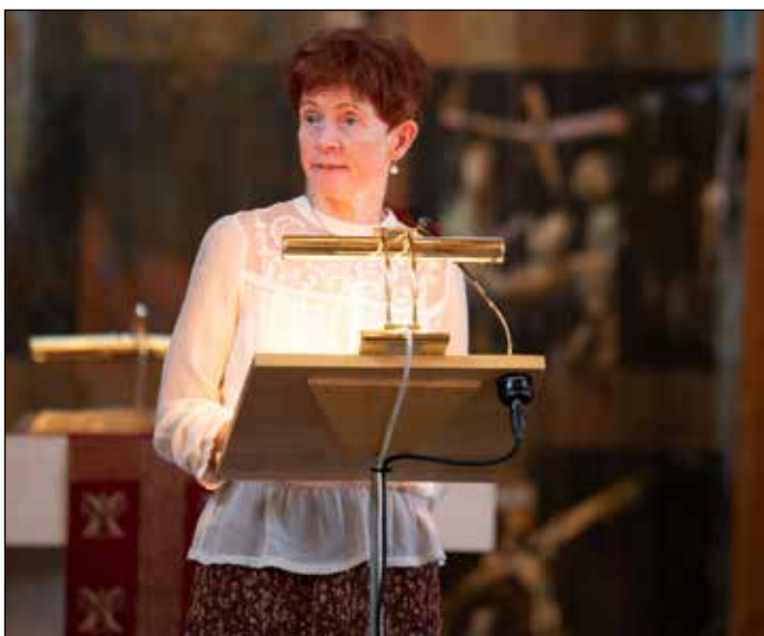
Kirkeverge Line Langseth Bakkum hilste fra kirkeetaten i Gjøvik