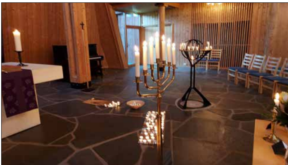
Det gjør godt å tenne et lys i mørket