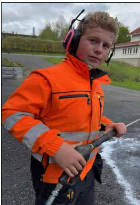
Simen i kjent og kjær stil