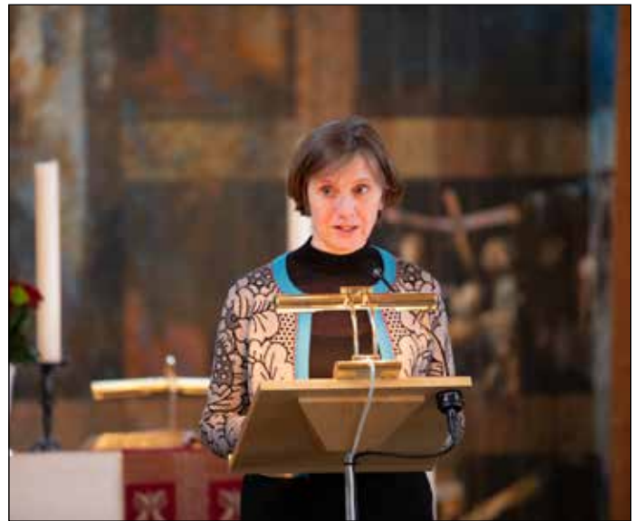
Statsråd Kjersti Toppe gratulerer oss med kirkejubileet