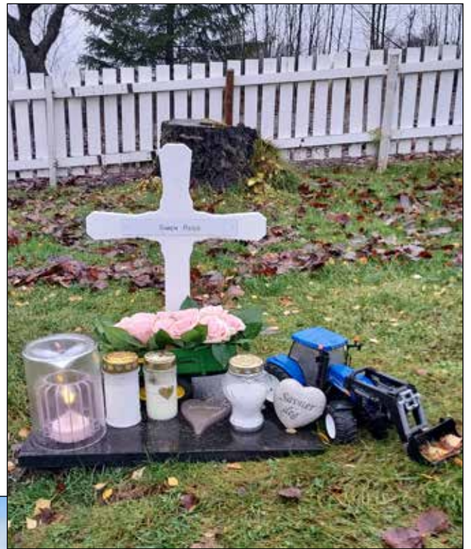
Nå er urna på plass ved Nykirke