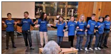
Lys våken dansen fremføres med glød