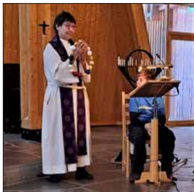
Dagens preken handlet om kristuskransen. Om vår omsorg for hverandre og Guds omsorg for jorden og alt han har skapt

Videre ble det servert kirkekaffe før det ble vist film fra alle kirkene hvor ungene var samlet til Lys Våken. En takk til gode ledere og frivillige i Menighetsrådet for en aktiv og fin samling i kirken.