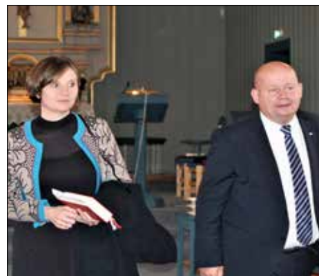
Statsråd Kjersti Toppe, ordfører Torvild Sveen på veg ut av kirken