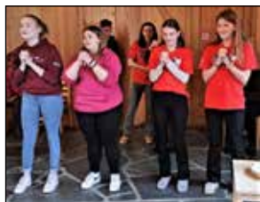
Lupy-lederne som loset ungene gjennom ei fin samling med Lys våken helg