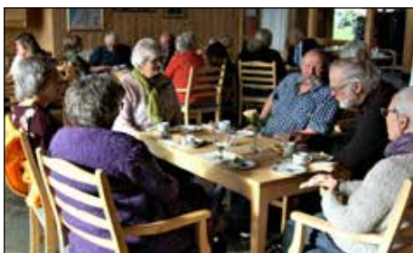
Mange deltok på kirkekaffe