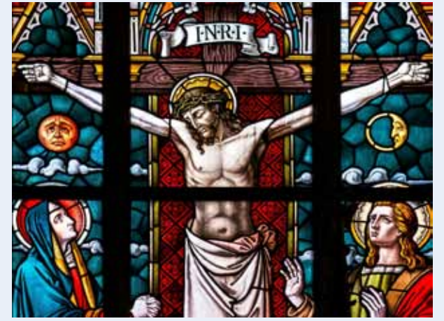
Johannespasjonens tekster er hentet direkte fra lidelseshistorien i bibelen.