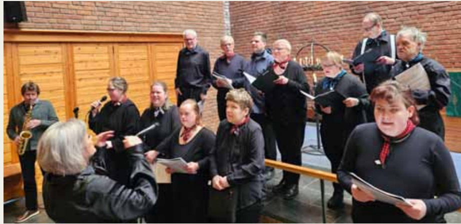
Koret Korpus har flotte sanger og formidler et viktig budskap om tro, håp og kjærlighet.

Søndag 16.februar deltok koret Korpus og Korpus scene i gudstjenesten i Hunn kirke. Det ble en flott fremføring av viktige tema rundt glede og fellesskap og sangene gikk rett til hjertet.