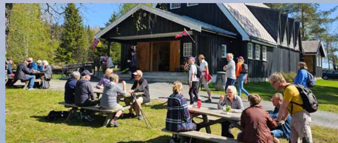
Kristi Himmelfartsdag 29.mai. Pilgrimsvandring fra Gjøvik kirke kl 09.00. Servering ved Bråstad kirke og gudstjeneste kl 13.00. Bildet er fra 2023.