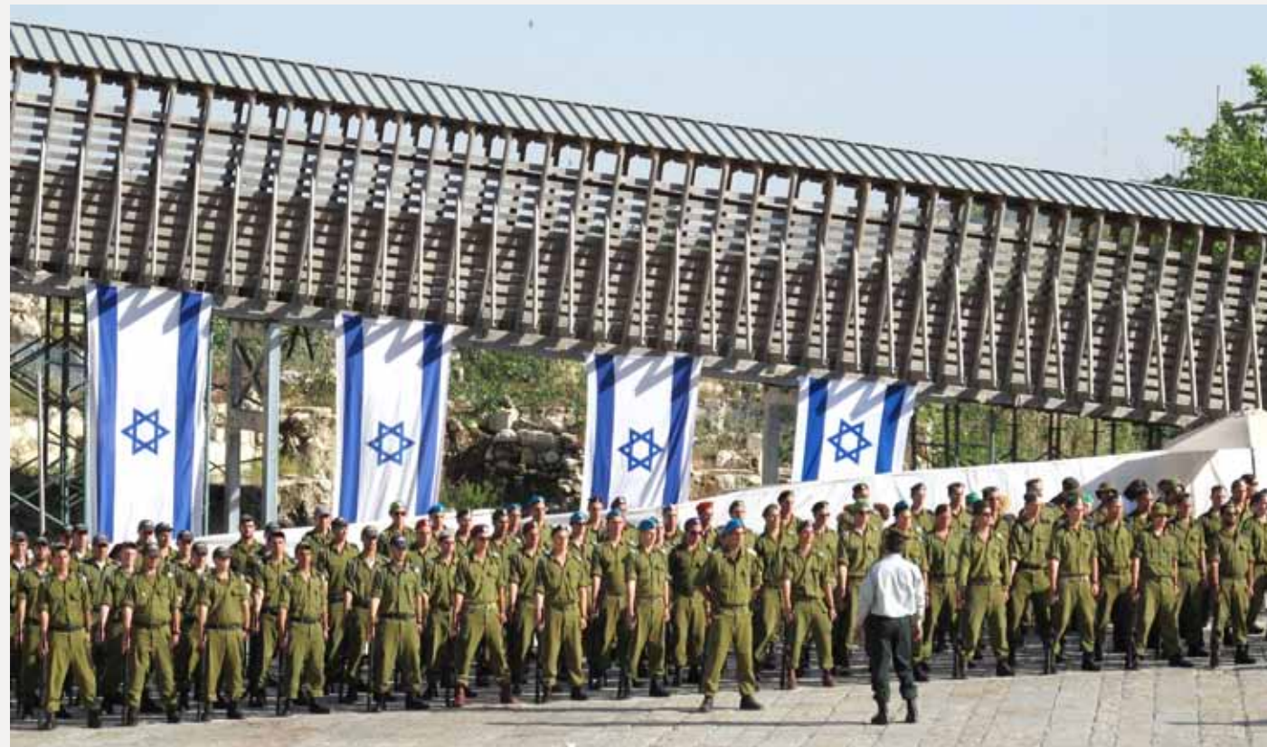
Det er ingen ting i Jesu forkynnelse som tyder på at staten Israel skulle være en oppfyllelse av Guds løfter om et land. Jesus sa at hans rike ikke var av denne verden. Staten Israel må bedømmes ut fra samme folkerettslige prinsipper som andre stater. Bildet er fra en militærparade i Jerusalem.