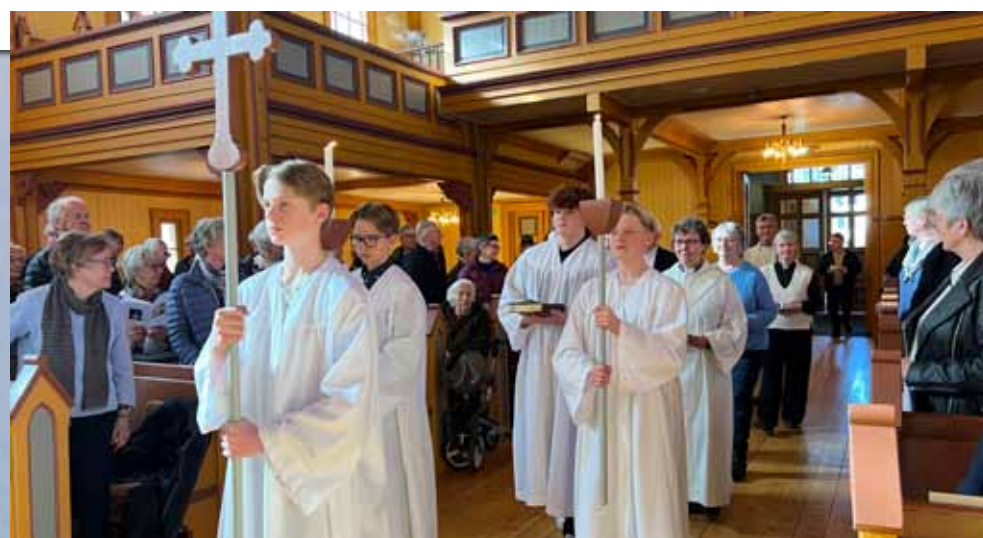
Fra gudstjenesten i Gjøvik kirke 23.mars som NRK overførte i radio og TV.