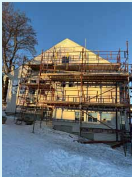
Vardal menighetshus pusses opp nå. Bidrag kan sendes på VIPPS 74491.

Vedlikeholdet blir finansiert med oppsparte midler, og vi er helt avhengig av ga-