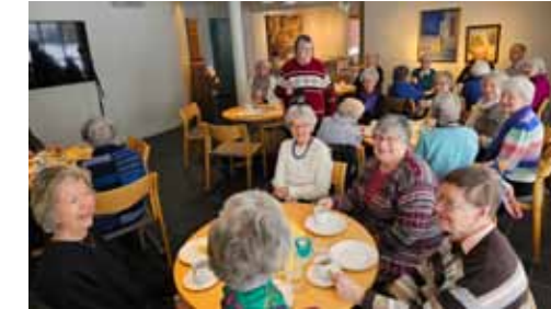
Hver måned er det formiddagstreff i Engehaugen kirke med et kulturelt program, andakt, sang, kaffe, god mat og sosialt samvær, her fra 21.februar 2025.

Onsdag 11. juni kl. 11.00-13.00. Ta med det du vil grille, vi spanderer drikke og salat.