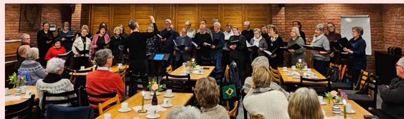
Fredheim blandede kor var med på allsangkvelden i Hunn kirke 18. februar.

kaféer, butikker, torgscene, lederkro, samtalefelt, tro- og livsynstelt". I Leirkirken blir det morgen- og kveldsbønn og noen korte nattverd-gudstjenester. Kunne du tenke deg å ta en to timers vakt som vertskap i leirkirka? Send tekstmelding til 915 31 830.