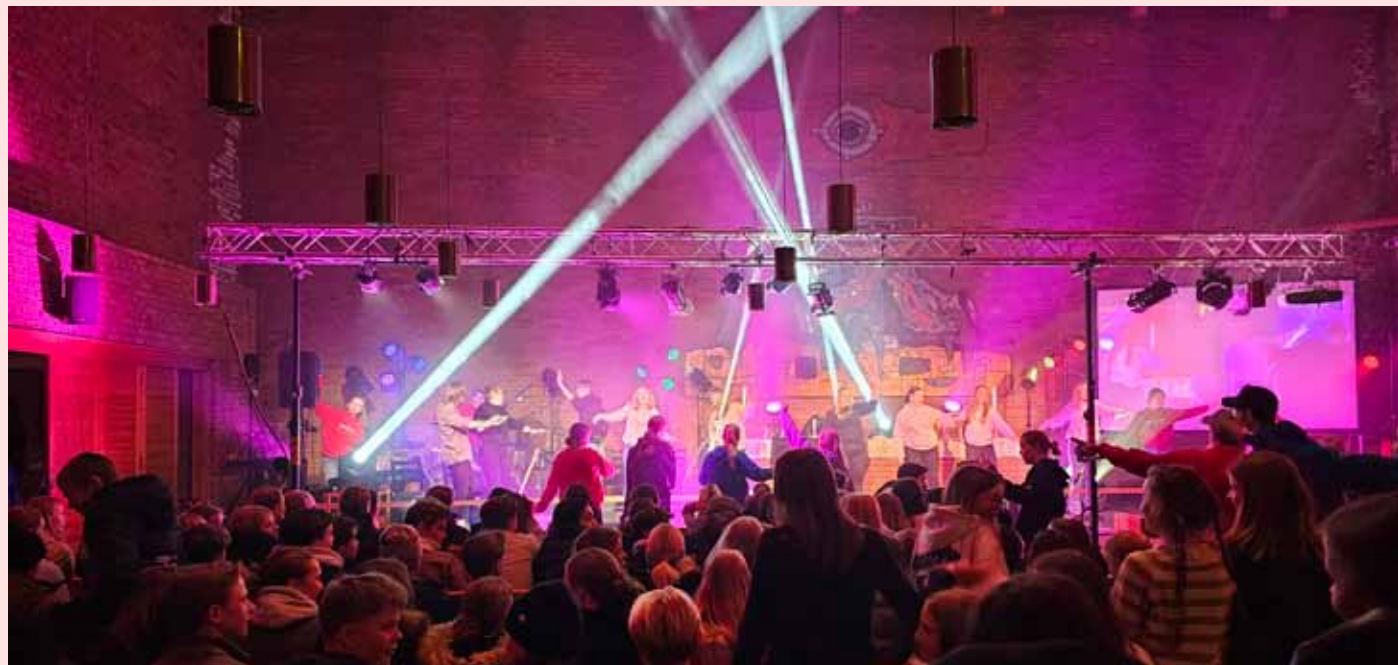
Konfirmantenes Kickoff i Hunn kirke 24.januar ble en stor suksess.