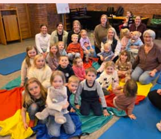
Superonsdag har blitt en hit for småbarnsfamilier.

For barnefamilier hver onsdag i skoleåret: Middag kl 16.45 (påmelding i appen Spond) og Familiesprell kl 17.30 (førskolealder)