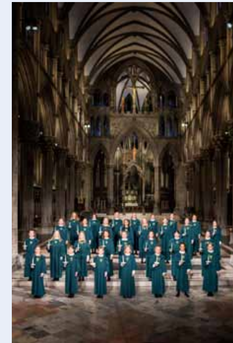
Det blir storfint besøk i Gjøvik kirke lørdag 31.mai. Nidarosdomens jentekor gir en halvtimes gratiskonsert.