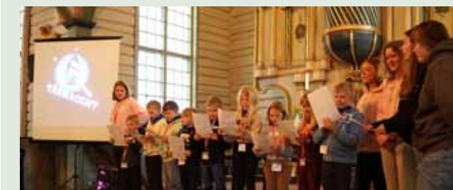
Tårnagentene opptrer på gudstjenesten i Vardal kirke.

Kristenretten (1024) og Magnus Lagabøtes landslov (1274) ga oss en human lovgivning. Det ble forbudt med blodhevn, tvangsgifte og å sette ut barn med misdannelser. Kong Magnus fikk innebygd en original passus om at loven måtte anvendes i pakt med de sentrale verdiene: sannhet, rettferdighet, fred og barmhjertighet . Kirka i middelalderen kalte disse verdiene for «Guds fire døtre». De var hentet direkte fra Bibelen: Miskunn og sannhet skal møte hverandre, rettferd og fred skal kysse hverandre. (Salme 85) Disse verdiene skulle være styrende for politikk og domsvesen. Hvilket strålende bidrag til politikken! Og ikke akkurat mindre aktuelle.