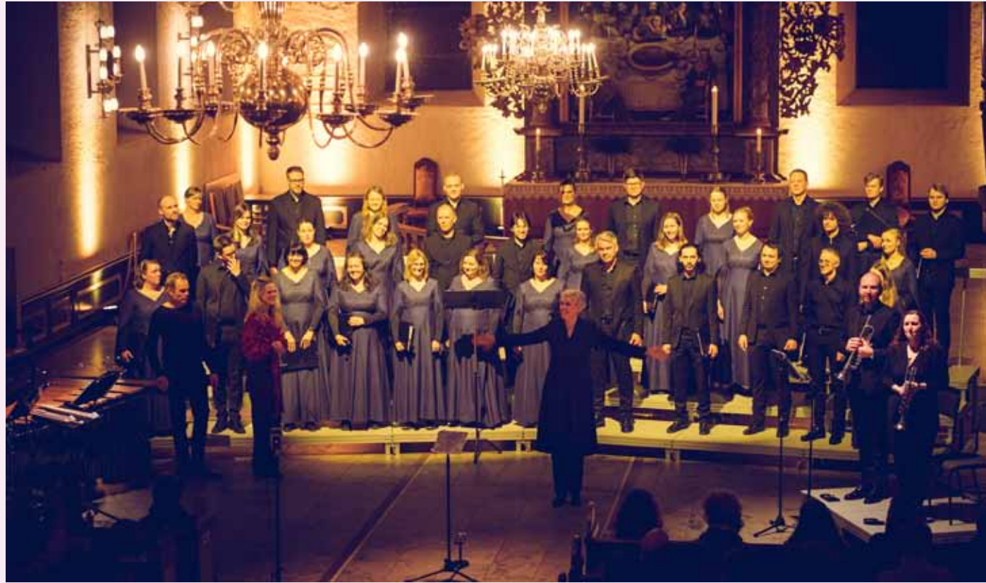
Oslo Domkor er en av Norges ledende formidlere av kirkemusikk.