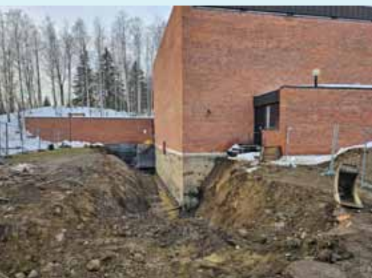
Tre meter under bakken måtte man for å finne rørene for vann og avløp.

Hunn kirke nærmer seg 60 år. Med det er også forventet levetid for kloakkrørene passert. Nå i vinter ble det akutt forstoppelse og kirkevergen så ingen annen løsning enn å engasjere Gjerdalen service til å grave opp de gamle vann og avløpsrørene og legge nye. Rørene ligger tre meter under bakken og det var mye masse som måtte flyttes. Jobben ble utført på profesjonelt vis. Men det skjedde i mildværsperioden i mars da det øverste laget var tinet søle og en meter med tele hindret at fuktigheten ble sugd opp. Folk med vitige tunger og sølete støvler kommenterte at Jesus gikk på vannet, mens dagens disipler går på sølehavet.