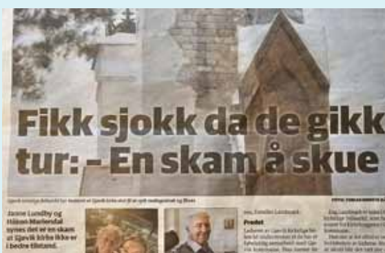
Faksimille av OA 28. januar 2025

Det er 11 kirker og kapeller i Gjøvik og