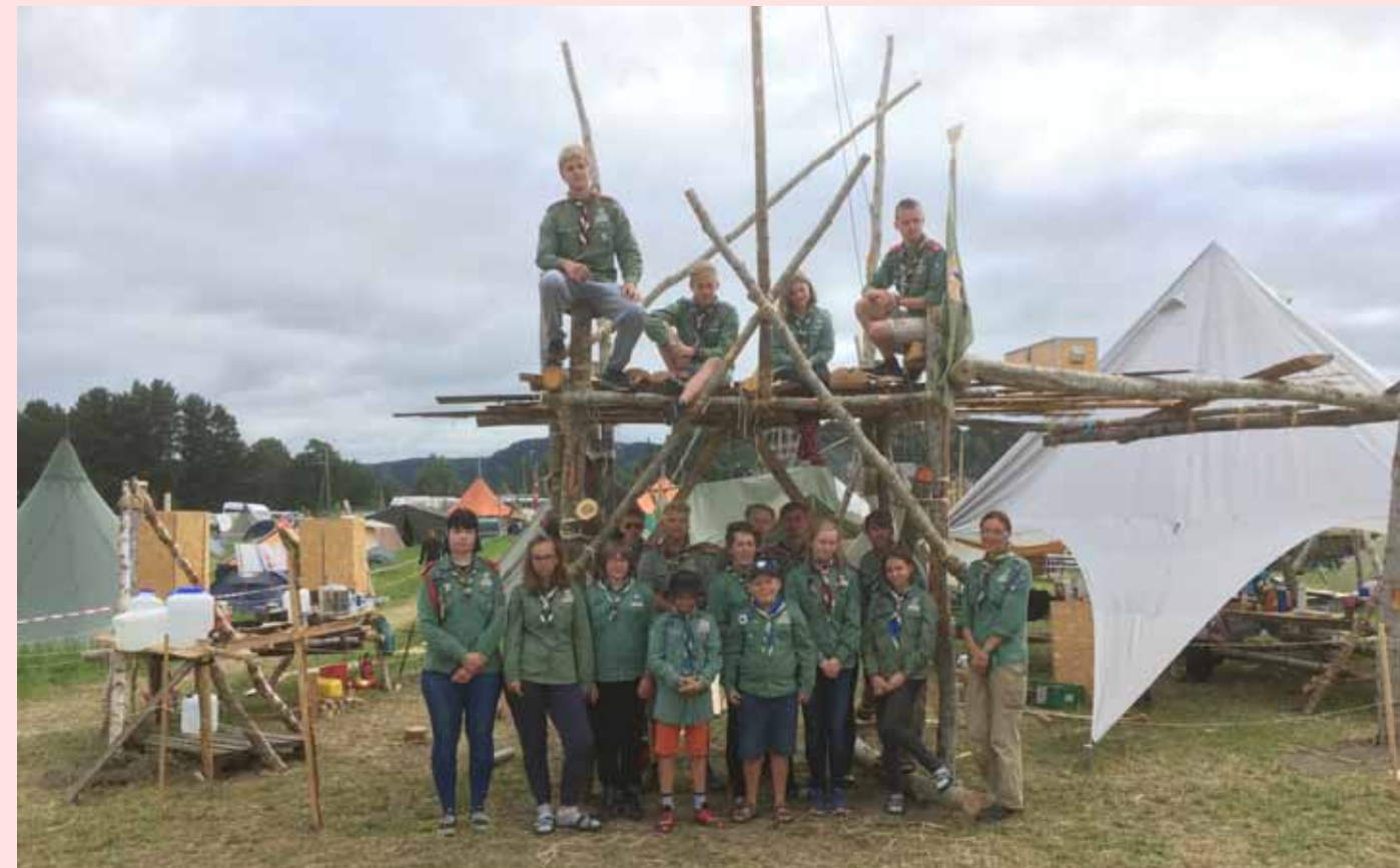
Det er stas for våre lokale speidere at årets landsleir blir på Vind. Her ser vi speidere fra Gjøvik, Lillehammer og Hadeland på landsleir på Stjørdal i 2018.