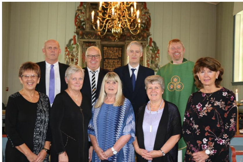
En flott gjeng med gullkonfirmanter 2017

Menighetsbladet er en nyttig informasjonskanal for menighetsrådet. Det ble utgitt 4 nummer av bladet med opplag på 2500. Bladet deles ut til alle husstander i bygda og sendes også til utflyttede gjerdrumsokninger og andre som ønsker det.