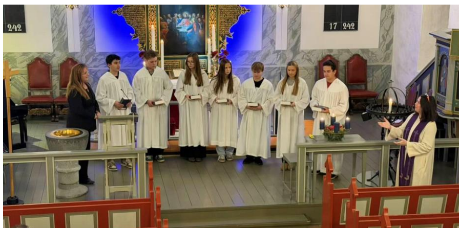
Konfirmantpresentasjon i Torsnes. De deltok med tekstlesning, lyttening og julesang på årets Lysmesse med 7 lesninger fra Bibelen.