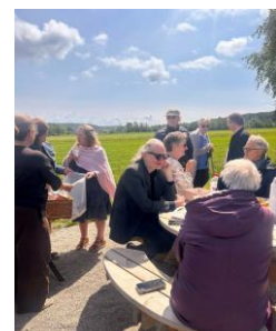
Benker og bålpanne inviterer til en rolig og hyggelig atmosfære.