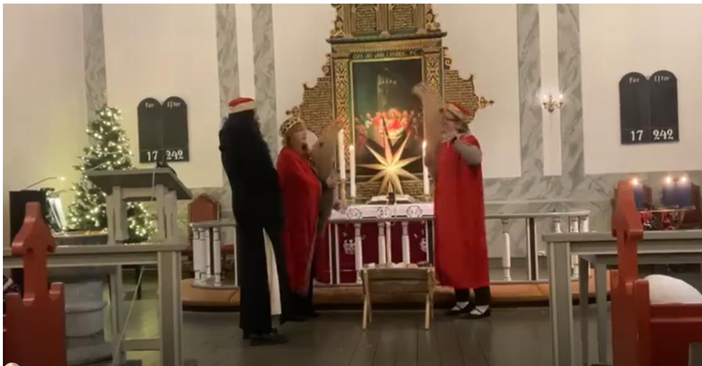
Et glimt fra skolegudstjeneste julen 2025

Menighetene på Østsiden har hver sine trosopplæringsplaner. Fra og med 2025 kalles dette nå Kirkelig undervisning og læring, forkortet til KUL. I 2025 gikk vi også over til å rapportere for all kirkelig virksomhet i «Kirka vår.» Her rapporteres kirkelig undervisning, aktiviteter, skole-kirke- og Barnehage-kirke-samarbeid og diakonale aktiviteter om hverandre. Foreløpig er det ikke mulig å hente ut statistikker og oversikter spesielt for kirkelig undervisning, men det kommer på plass etter hvert.