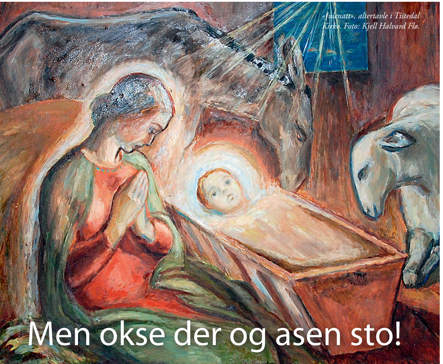
«Julenatt», altertavle i Tistedal Kirke.