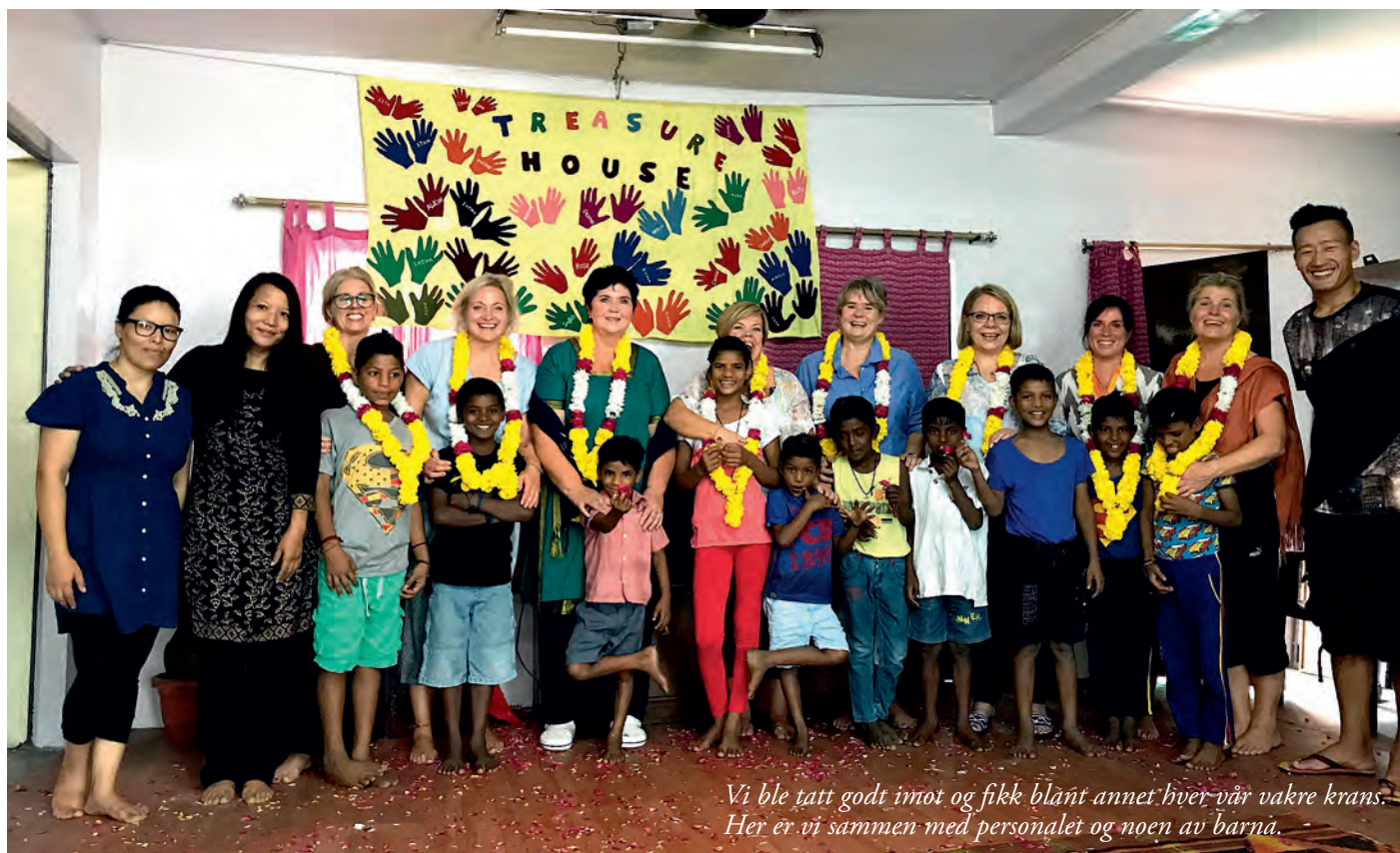
Vi ble tatt godt imot og fikk blant annet hver vår vakre krans. Her er vi sammen med personalet og noen av barna.

aldri slipper taket og gutten med stort sår under øyet etter slag fra et belte.