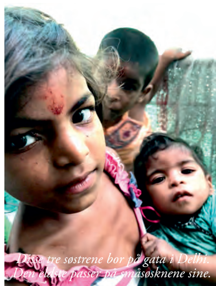
Disse tre søstrene bor på gata i Delhi. Den eldste passer på småsøsknene sine.

Prosjektet er felles for Onsøy og Gressvik menigheter. Merk innbetalingen med India.