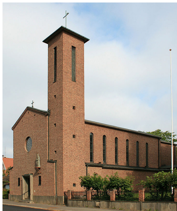
St. Torfinn katolske kirke på Hamar.

Han må ha vært cistercienser-munk i Trøndelag. Etter sin død testamenterte han 20 norske mark til Tautra kloster, som ligger i Trondheimsfjorden, og dette tas som et tegn på at det var i dette klosteret der Torfinn hadde sine røtter. Han ble omtalt som korbros i Nidaros i 1273 og 1277, hvor han ved siste anledning også ble oppgitt som vitne ved den såkalte «sættargjerden», hvor kong Magnus VI Lagabøte lovet å respektere kirkelige rettigheter og tillate frie valg, og slik avsluttet de