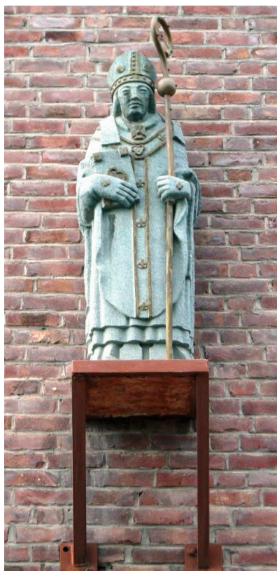
Statue av St. Torfinn i St. Torfinns kirke.

Han må ha vært cistercienser-munk i Trøndelag. Etter sin død testamenterte han 20 norske mark til Tautra kloster, som ligger i Trondheimsfjorden, og dette tas som et tegn på at det var i dette klosteret der Torfinn hadde sine røtter. Han ble omtalt som korbros i Nidaros i 1273 og 1277, hvor han ved siste anledning også ble oppgitt som vitne ved den såkalte «sættargjerden», hvor kong Magnus VI Lagabøte lovet å respektere kirkelige rettigheter og tillate frie valg, og slik avsluttet de