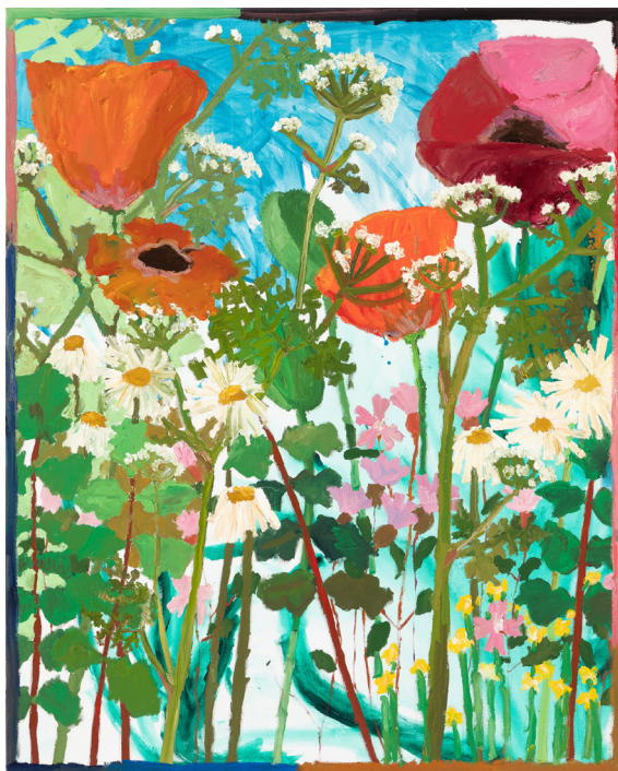
Stems 2021(stengler el stilker) olje og akryl på canvas B x H = 145 x 180 cm