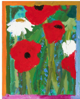
Summer greetings 2021 Olje på canvas B x H = 40 x 50 cm.

Da er det godt å være strukturert og samtidig glad i å jobbe. Det første har hun allerede sagt hun er. Det andre bekrefter hun i sitt neste svar der hun sier spontant at gleden ved å jobbe i atelieret, er hennes største glede ved å være kunstner.