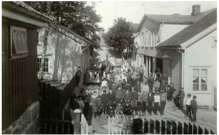
Skolebarn ved Brakken i O.A. Hauges vei, Gressvik. Skolen i "Brakken" (til h. i bildet) var privat eiet bruksskole ved Græsvik Brug. Gressvik Bruks skole i bakgrunnen bak trærne.

Flere fastskoler kom utover på attensekstallet. Åle skole sto ferdig i 1865. De samarbeidet den første tiden med lærere fra «Brugsskolen». Skolen ble lagt ned i 1938. På Halvorsrød mellom Solbrekke og Slevik sto også en skole ferdig i 1865. Den ble lagt ned da Slevik skole ble bygd i 1904. I 1865 sto også Manstad skole