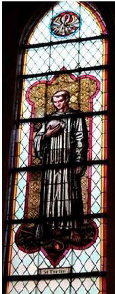
Glassmaleri av St. Torfinn av Hamar i St. Olav domkirke i Oslo.

Da den daværende abbeden i klosteret Ter Doerst 60 år etter Torfinns død ville la hans grav jevne med gulvet, ble den åpnet, og det strømmet en søt vellukt opp fra den og fylte hele kirken. Dette utløste undersøkelser om hvem dette var, og en gammel munk husket Torfinn,