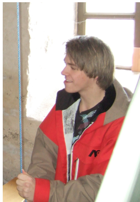
Over og under: Konfirmanter i arbeid som klokkere på "Ung messe" 23. januar.