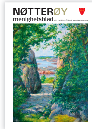
Forsidebildet: Den italienske port på Tjøme. Privat eie.

Torød kirke og kirkestue 479 74 937 Kirketjener/vaktm. Katja Lagensteiner Tripp-trapp åpen barnehage 40 03 48 81