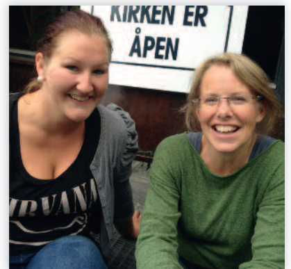
Endringer i staben