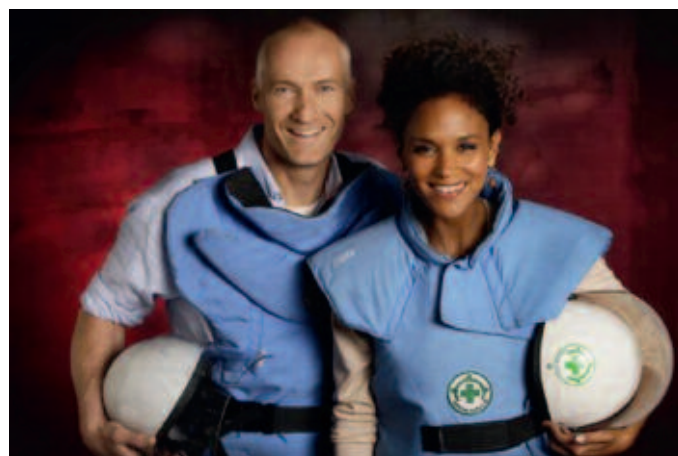
En gammel Folkehjelper og en erfaren programleder skal stå foran kamera under NRKs TV-aksjon søndag den 23.oktober

Det finnes ikke én løsning på rydding av miner og klasebomber. Hvert område har spesielle utfordringer og egenskaper, avhengig av konfliktens omfang, lengde og type. Landskap, klima og infrastruktur setter også betingelser. Derfor har Norsk Folkehjelp utviklet en komplett verktøykasse for mine- og eksplosivrydding: Kartlegging av problemet, manuell rydding, minehunder og mekanisk rydding.