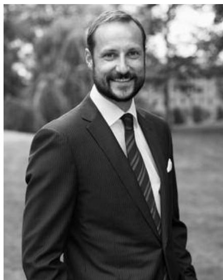
H.K.H. Kronprins Haakon er høy beskytter for årets TV-aksjon.

Hver eneste dag drepes og lemlestes uskyldige mennesker av miner- og klasevåpen. Dette er en forferdelig trussel for menneskene som bor i disse områdene. Miner og klasebomber ligger gravd ned på over alt. Det er ikke uvanlig å finne eksplosiver på skoleveier, lekeplasser, dyrket mark eller langs veien. Bare i Laos ligger det igjen 70 millioner klasebomber etter Vietnamkrigen.