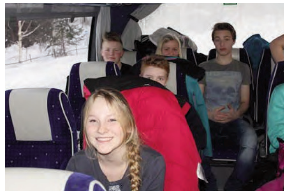
Spente konfirmentar på veg til Lillehammer