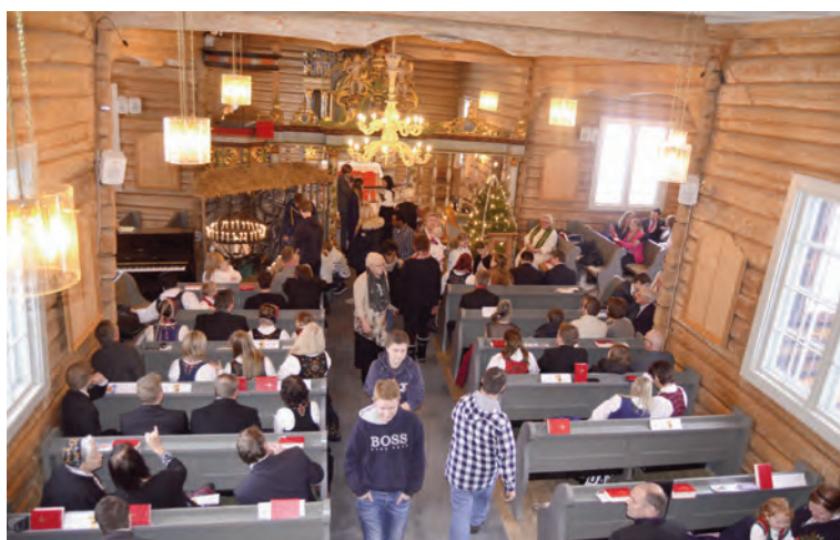
På vandring til ulike stasjonar i kyrkja