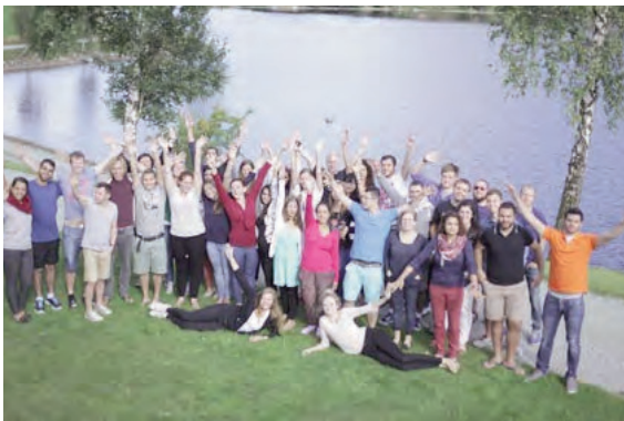
Utrusting av fredsagentar

Etter oppstarten i 06/07 har tre ”kull” vore gjennom BB-programmet. Fjerde kullet var samla til første bolken av programmet nå i sommar. Det innebar at 10 messianske jødar, 10 arabarar/palestinarar og 10 nordmenn, - alle kristne ungdomar, - var samla vel ei veke på Vaulali Leirstad i Rogaland, - midt i flott norsk natur! Dei var ilag på krevjande turar, i teambuilding, leik og kveldar med kulturprogram.