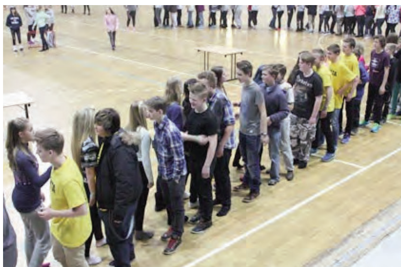
Klemmekø var eit populært tiltak