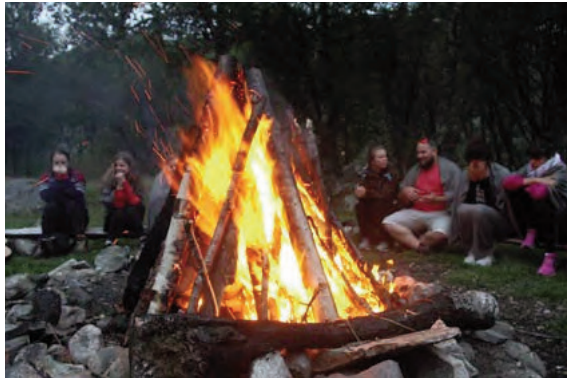
Brubyggarsamling i Noreg

kamp å ta inn over seg de kjensler, historier og den sorga dei andre deltakarane bar på. Likevel var gleda over at vi var der, gjensidig.”