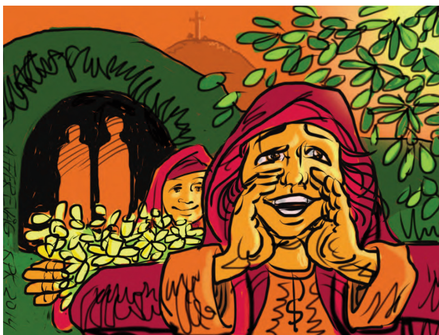
Illustrasjon: Anders Færevåg

Noen vil selge oss bøker om de tusen steder vi i vår selvrealisering og utvikling bør besøke før vi dør. Lukas tar oss ganske gratis med til et sted hvor døden sitter igjen med en tom grav. Tomheten tilhører døden, troen tilhører livet.