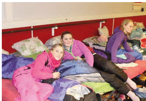
På feltseng med madrass var det lagt til rette for litt søvn...