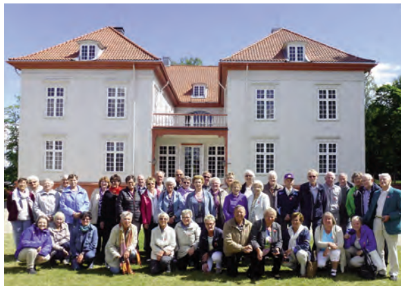
Eidsvollsmenn og -kvinner frå Etnedal: Helselagsfolk frå Etnedal var i juni på tur til Eidsvoll, der det var ei interessant historisk omvising. På biletet er dei fleste samla framfor den berømte bygningen.