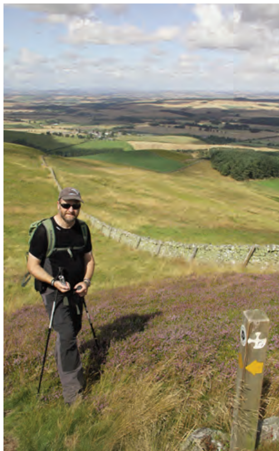
Langs St. Cutberts vei over The Wide open hill, med noen av de flotte steingjerdene langs ruta.

Det var en åpenbaring å skue havet og øya etter flere dagers vandring. Over til øya kan en