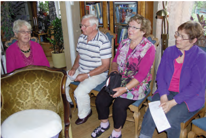
Utsnitt av forsamlinga