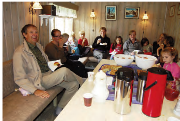
Utan mat og drikke... Ein heil gjeng søkte inn på kjøkkenet