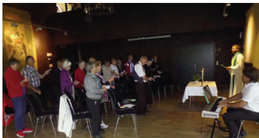
Frå gudstenestesamlinga i museumssalen

Søndag går husfolket til gudsteneste, og det er sjølvsagt ope for alle som vil.