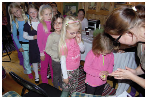
Og så var det premierung. Viskelær, ball og blyant er ikkje dumt å ha med seg på skulen. Og på viskelæret sto : God loves you, Gud elsker deg. Godt å hugse på når vi skal inn i nye utfordringar.