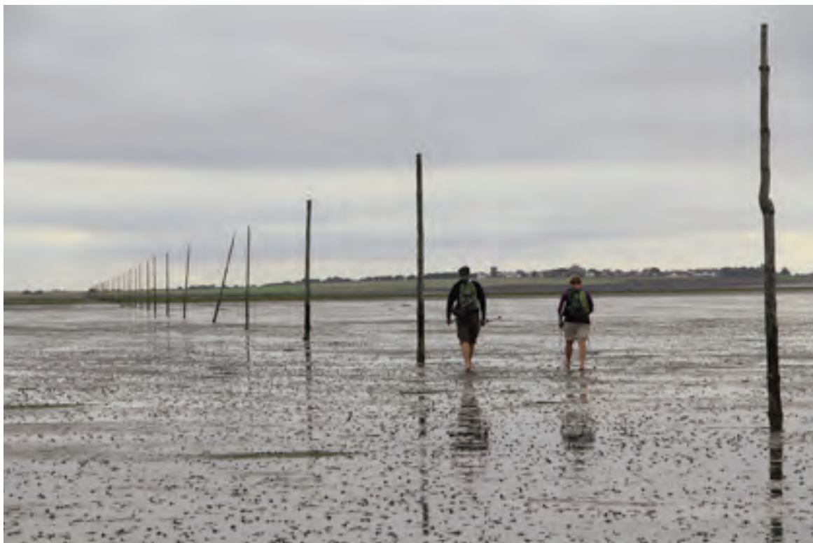
Barfot i sanda langs den merkede pilegrimsruta over til The Holy Island, mens tidevannet trekker seg tilbake