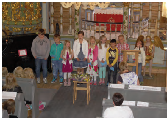
4. klasse fortalde om Mariablomster og sang Alf Prøysen.