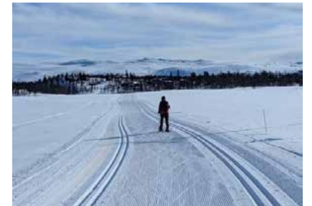
Velpreparerte skiløyper.