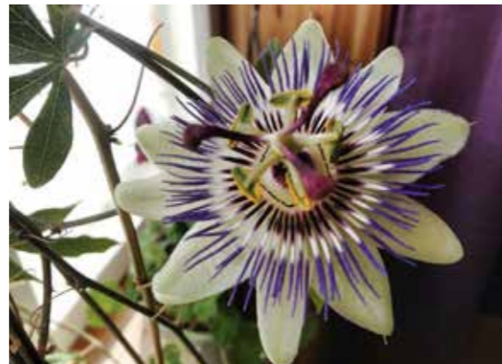
Pasjonsblomst, foto: Marit prest