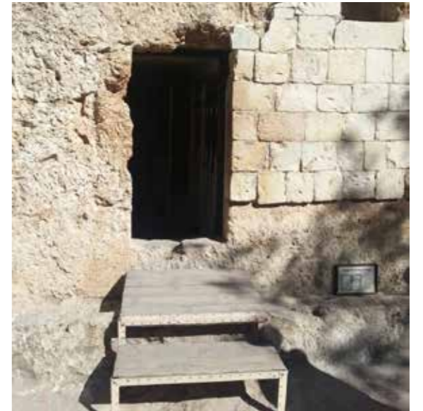
Frå Gordons Golgata Tom grav i klippen

Jesus ba for sine bødlar, synta omsorg for sin mor, og