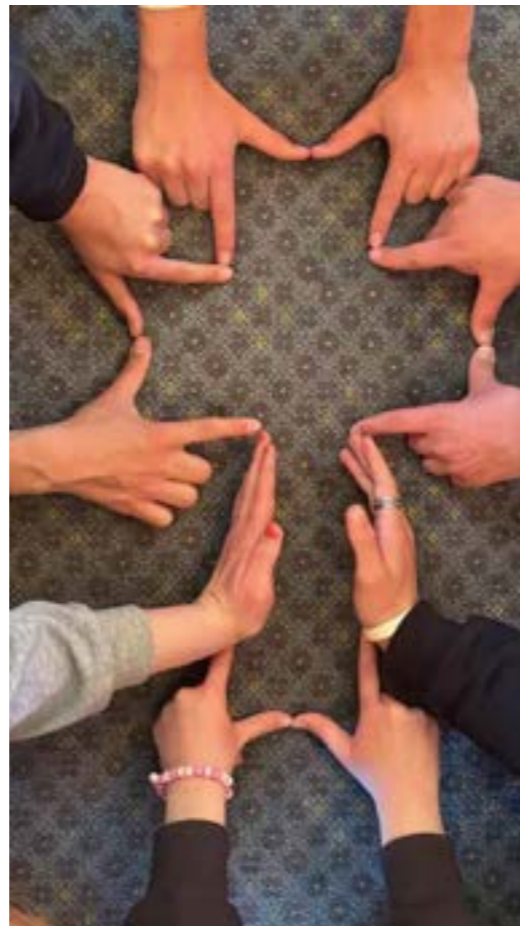
Krossformasjon ved fjorårets konfirmanter

Døden må vike for Gudsrikets krefter! Livet er gjemt i et jord-dekket frø. Se, i oppstandelsens tegn skal vi leve. Se i oppstandelsens lys skal vi dø.