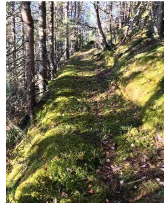
Vårsti i Sør-Etnedal.

På s. 6-7 har eg prøvd meg på ei «forteljande påskevandring» der eg trekker fram sentrale bibeltekstar. Det er ein invitasjon til å fylgje Jesus på hans «påskeveg» fram til den store sigersdagen, Påskedag.