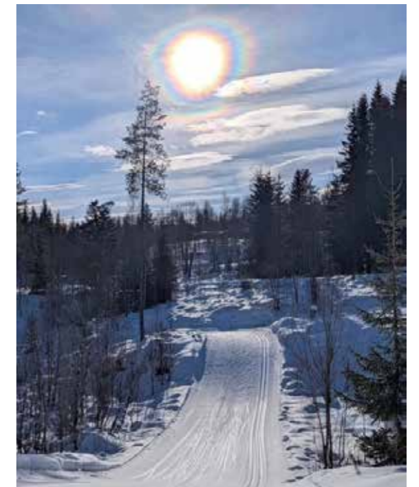
Regnboge rundt sola, eit spesielt syn.