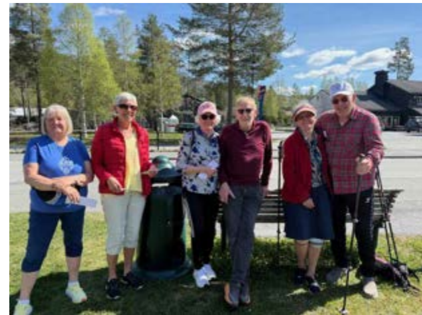
Frå hjartemarsjen i 2025