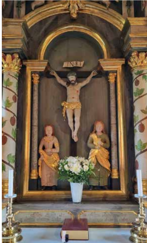
Altartavla i Bruflat kyrkje