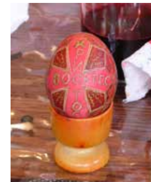
Påske-egg frå Ukraina

Forside, foto: Marit prest Altartavla i Seegård kirke, Snertingdal. Håkon Blekens mektige kunstverk: Oppstandelsen Bakside, foto: Anne Flugstad Øistuen