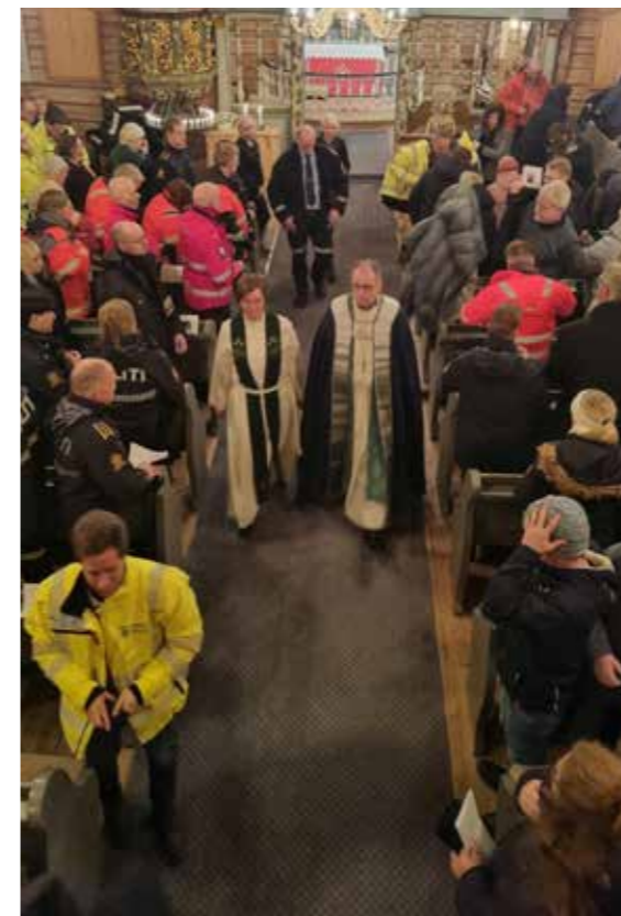
(frå markeringa i kyrkja.)

Det var FTU, i samarbeid med Trygg trafikk, Den