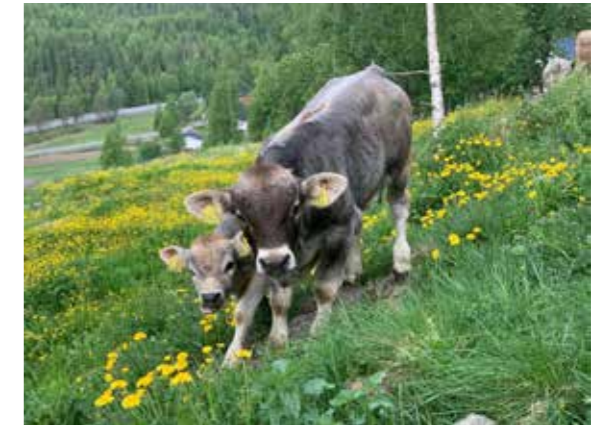
Godlynte dyr, tyrolerfe, mohairgeiter, høner og påfugl ... Spennende miljø på Kulturbeitet