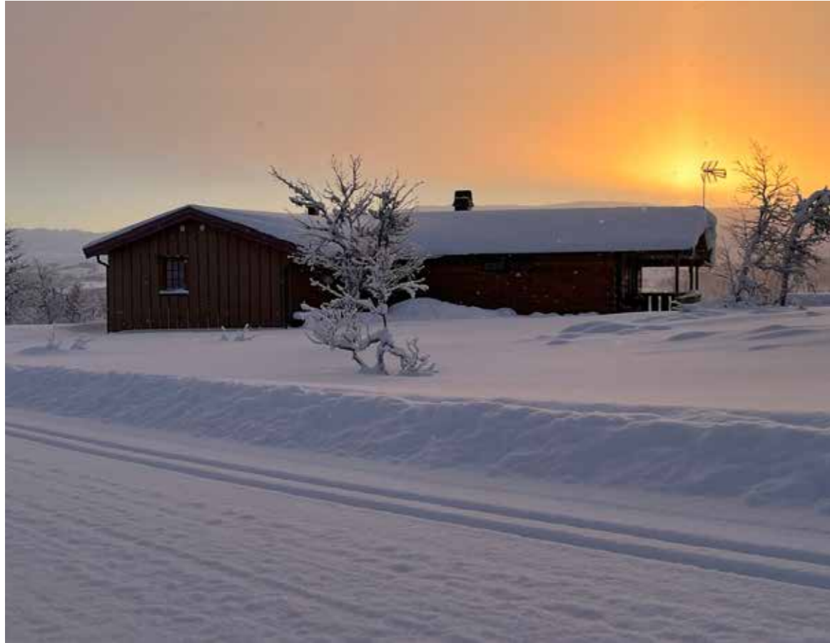
Stemningsfullt hyttebilde med glimt av velpreparert skiløype

Etnedal er en stor vertskommune for hyttefolk og ett av de største hytteområdene finner vi på Lenningen. Tar man med området i Nordre Land som sokner inn i Etnedal, er det ca 350 hytter.