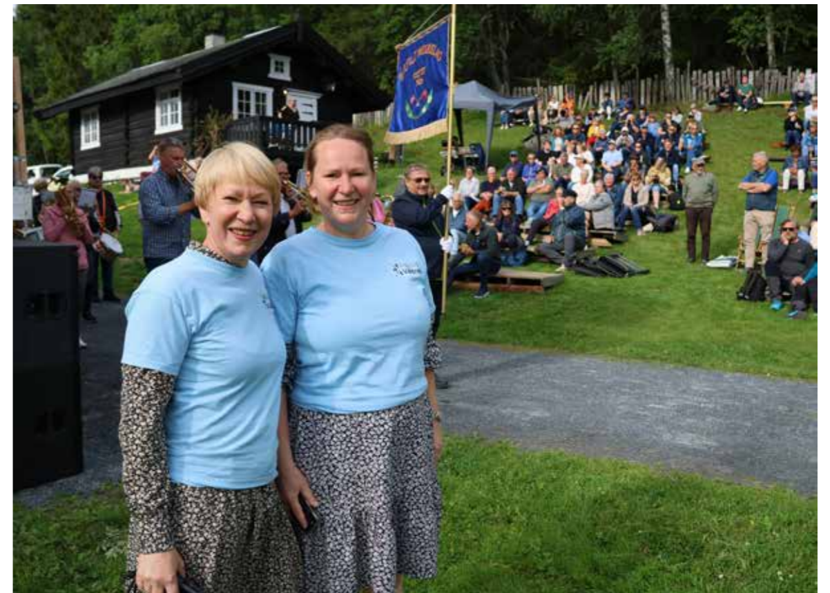
Søstrene inviterer også dette året til pleddfestival.