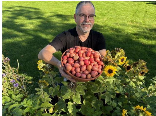
Egendyrkede poteter til høsttakkefesten.