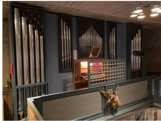
Orgelet i Enebakk kirke.