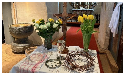
Enebakk kirke i med blomster i forgrunnen.

I tillegg til kirkens høymesser har vi hatt to godkjente ordninger som menighetens gudstjenester: Søndagsskolegudstjenestene er en forenklet gudstjeneste som setter barna tydelig i sentrum for alt som foregår i gudstjenesten. Torsdagssamlingene har en liturgisk ramme rundt et bestemt tema og en invitert gjest. De er nå flyttet fra Mari kirke til Mari menighetscenter som gir en god ramme også for det sosiale fellesskapet rett i etterkant av samlingen.