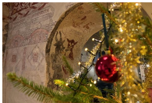
Jul i kirken.

Gudstjenestene er en sentral puls i menighetens liv og et viktig menighetsbyggende fellesskap. Vi har alltid kirkekaffe i forlengelsen av gudstjenestene. Dette anses som en viktig arena for å møtes ansikt til ansikt og er en viktig diakonal side ved gudstjenestefeiringen.