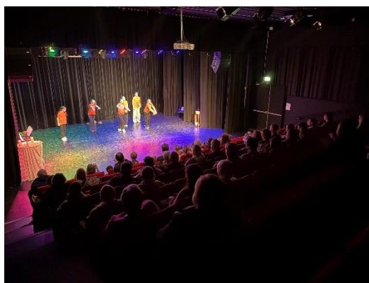
Danseinnslag i gudstjenesten i Enebakk kultursal.