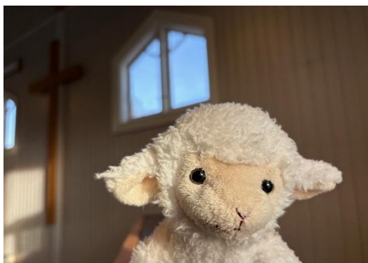
Krølle - den bortkomne sauen.