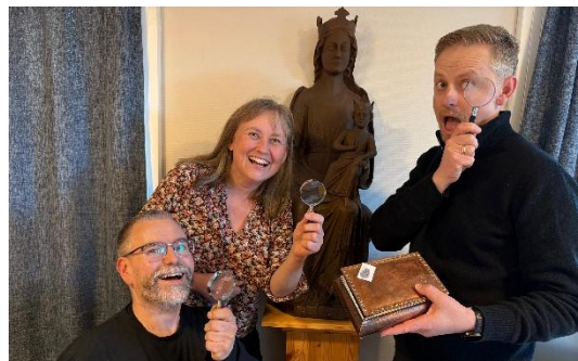
Denne gjengen er klar for Tårnagent-mysterier.