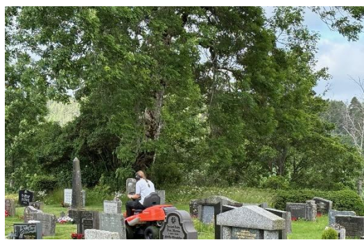
Sommer og gressklipping på gravplassen.

Denne delen av virksomheten styres av gravplassloven og dens forskrifter og er inndelt med et eget ansvarsområde i regnskapet. Det er et overordnet mål at denne delen av virksomheten er livssynsåpen.