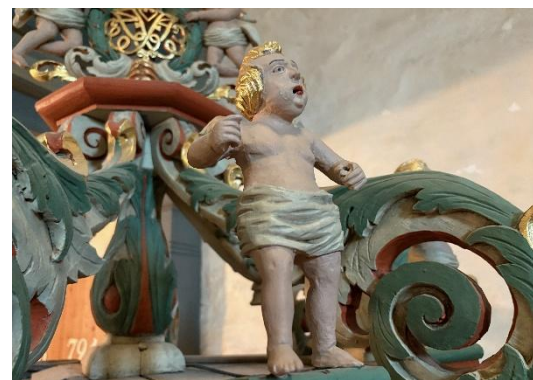
Engel på dåpshimling i Enebakk kirke.