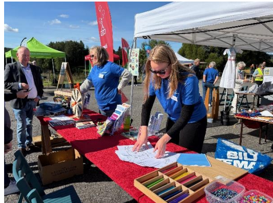
Kirken med frivillige på stand på Byggedagen.

Kirken ønsker å få til mer aktivitet på Flateby, og det har vært gjort forsøk med et aktivitetstilbud, Supersøndag kl. 1200 enkelte søndager for barn og foreldre utenom gudstjenestene. Juleverkstedet i desember var et vellykket arrangement med god oppslutning. Det ble holdt Krøllegudstjeneste med bokutdeling til 2-åringene på Flateby menighetshus i 23. november. 4-årsboken ble delt ut ved høsttakkefestgudstjenesten i Enebakk kirke i september.