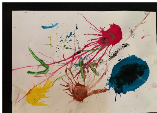
Kunstutstilling - bidrag fra Mariklubben.