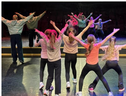
Fra øvelse på Dansedager.

Vi har fortsatt arbeidet med synlighet i nærmiljøet og med markedsføring, men ser at det stadig er mye som kan bli bedre. Kirken har hatt egen stand og markedsført aktiviteter for barn og unge på Bygdedagen. Halvårsbrosjyren er betydelig forenklet og fikk endret layout, slik at den ikke lenger er knyttet til enkeltdatoer for arrangementer. Det lages ellers flyers om enkelttilbud, som også promoterer på sosiale medier.