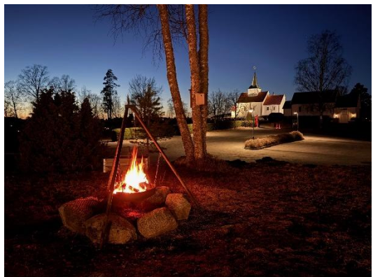
Lys Våken med overnatting i Mari kirke.