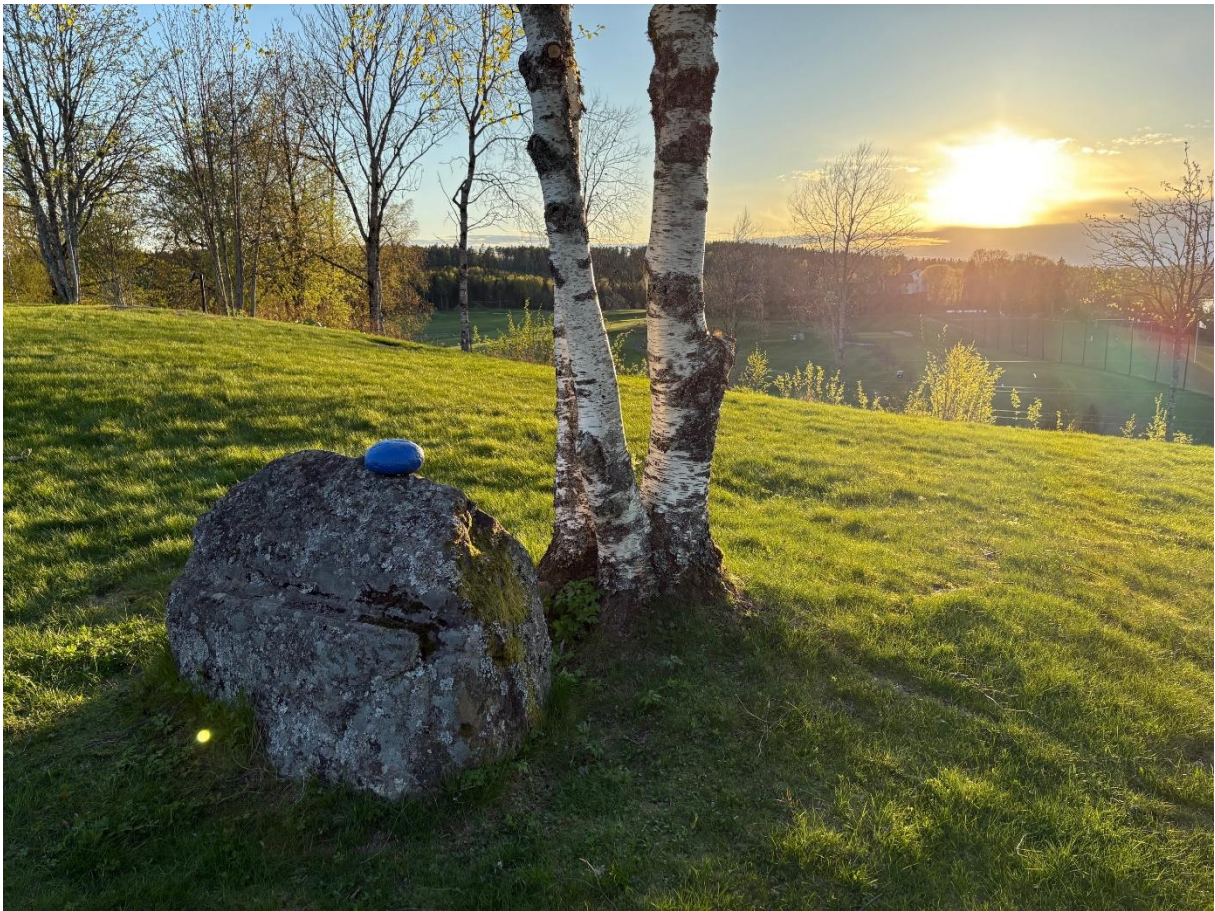
Bekymringsløshetens blå perle i solnedgang på Mari kirkegård.