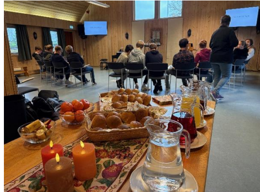
Beverting på konfirmandundervisning. En stor takk til de frivillige som baker, serverer og er til stede.

Konfirmasjonsgudstjenestene ble holdt i Enebakk og Mari kirker torsdag 29. mai (Kristi himmelfartsdag), lørdag 31. mai og søndag 2. juni.