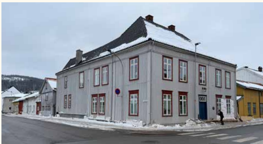
Bangegården, hovedbygningen på hjørnet, slik det ser ut i dag. Bak på venstre side ser en drengestuen og på høyreside foran, malt okergult, sidebygningen.

På Strømsø, fra Rundtom/Gåsevadet og nesten til bybroen etter Strømsø kirke, som er det området jeg nå skriver om, var bebyggelsen konsentrert fra elven og innover på land. Elven var «hovedveien», det var her handelen foregikk. Nederst langs elven hadde kjøpmennene sjøbodene sine. Mellom sjøbodene og bolighusene gikk Fremgaden. Der bodde kjøpmennene i hovedhuset. Videre, ofte tett inntil, var drengestuen, eventuelt en sidebygning og bryggerhus. Bak denne bebyggelsen var bakgården. Den bestod oftest av driftsbygninger som låve, fjøs og stall og eventuelt noe dyrket mark. Bakgården ga kjøpmennene tilgang til forråd, for butikker, slik vi har i dag, fantes ikke. Så kom en til Bakgaden, og på motsatt side i denne gaten var det bebyggelse med mye mindre hus, der arbeidsfolket bodde. Og helt til slutt, lengst vekk fra elven, var løkkene , som stort sett var eid av kjøpmennene.