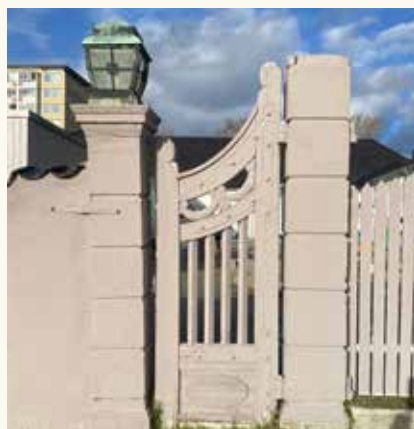
Venstre sideport - En liten rest av fordums prakt.

I «Rundt om Tangen» neste år vil dere få vite noe mer om de arbeiderboligene som fantes i bydelen. De forteller sin spesielle historie om området fabrikker og deres virksomhet og også om hvordan mange av bydelens innbyggere fikk arbeid og bolig.