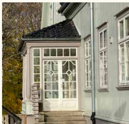
Vinterhave- også en rest av fortid,