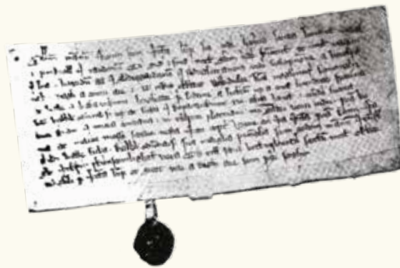
Pergamentbrevet fra 1340

De eldste data om Kobberviken er funnet i et pergamentbrev fra 1340. Kobberviken var den gang nevnt som et handelssted ved Drammenselvens munning. Den innerste og største delen av Tangen lå på Kobbervikens grunn og bar navnet Kobberviktangen. Den gang fant en i elven fortøyningspeler hvor skutene la til nedenfor den gamle driftsbygningen. Her la nok de hollandske båtene til da skipperne kom opp Drammenselven for å handle tømmer.