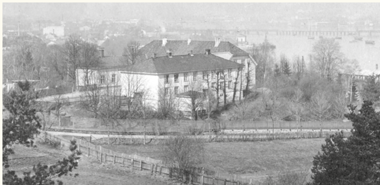
Kobbervik gård.

Så nærmer jeg meg Rundtom igjen og avslutningen på denne vandringen fra en storgård til en annen, bare ispedd noen spesielle hendelser som måtte få oppmerksomhet fordi vi i redaksjonen i Menighetsbladet ville markere disse begivenhetene i Tangen kirkes historie. Kobbervik gård har vært nevnt i noen sammenhenger tidligere, men nå er det stedet og gården det skal fortelles om.