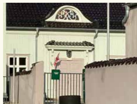
Den moderne inngangen til barnehagen, men det gamle inngangspartiet skimtes bak.