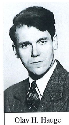
Olav H. Hauge

Det er den draumen me ber på noko vedunderleg skal skje, det må skje – tidi skal opna seg hjarta skal opna seg dører skal opna seg berget skal opna seg kjeldor skal springa – draumen skal opna seg, me ei morgonstund skal glida inn ein våg me ikkje har visst um. (Olav H. Hauge)