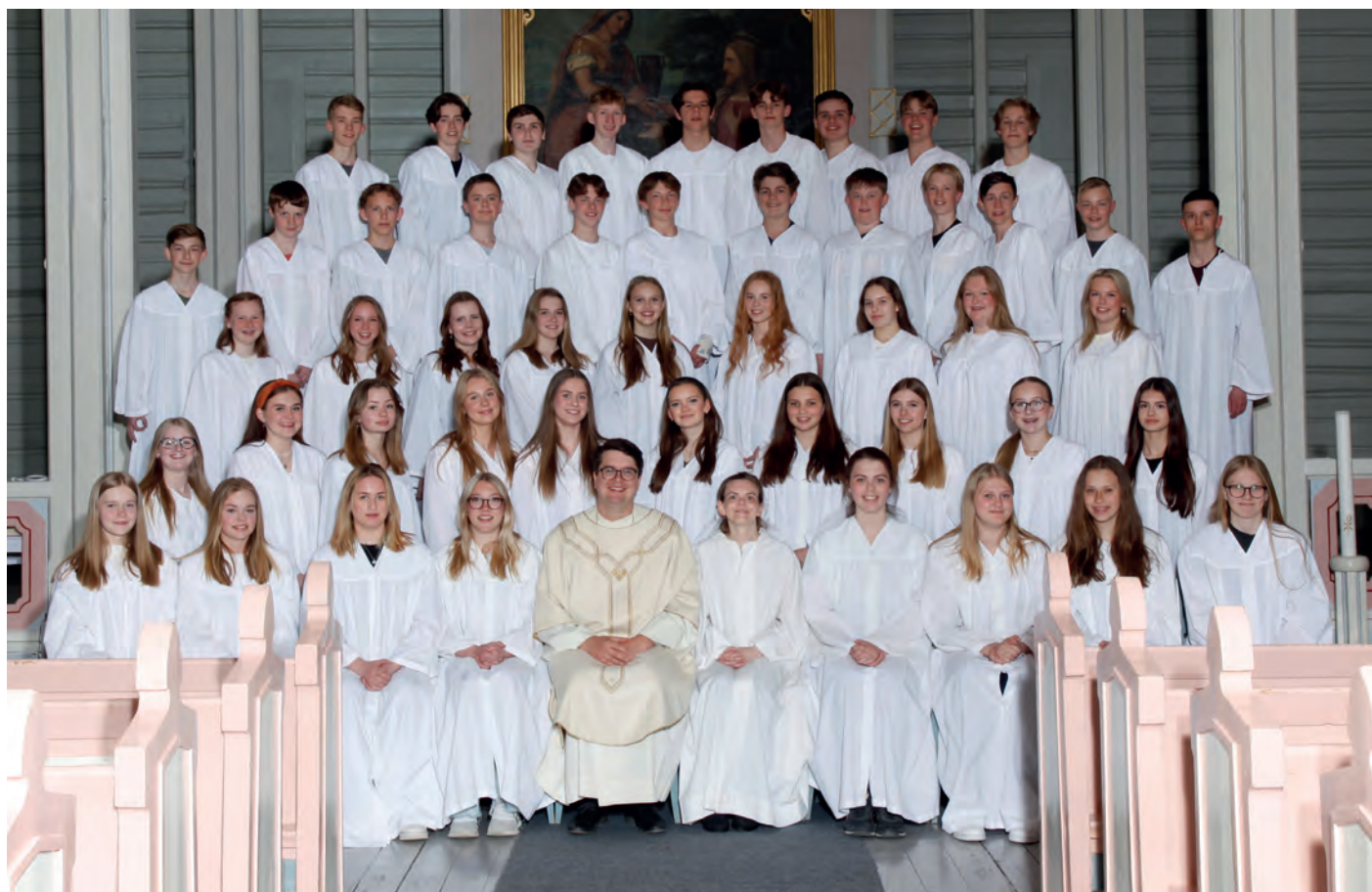
Konfirmanter 2022. Krokstadelva (øverst) og Solbergelva