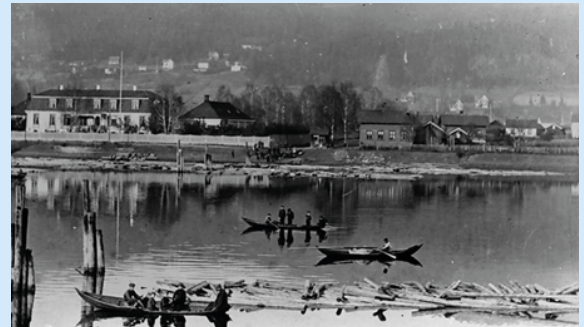
Nedsettere i arbeid.