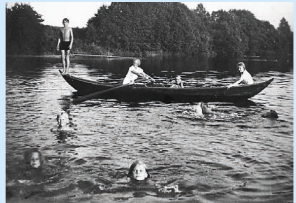
Nersetterbåt i Drammenselva.