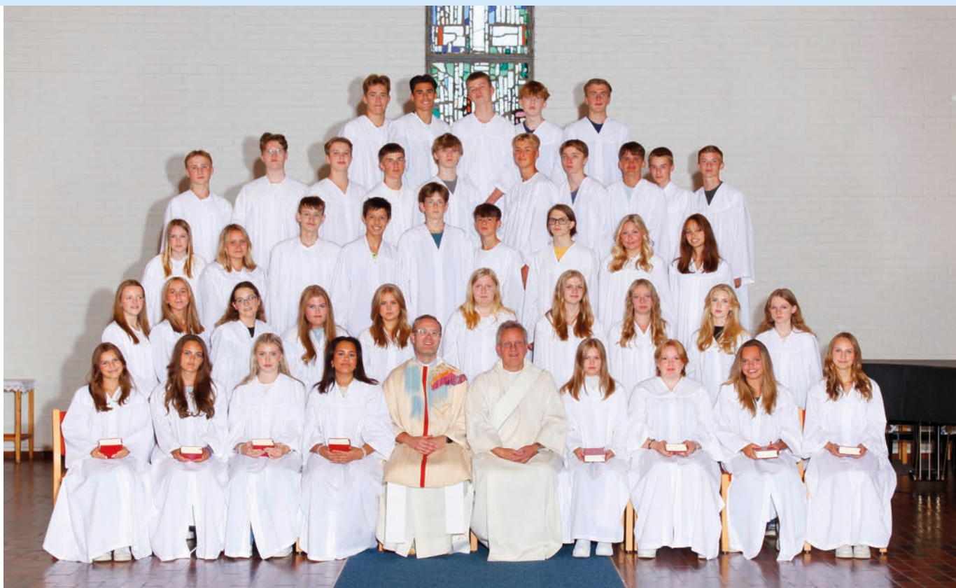
Bildet er av årets konfirmanter - 2023.