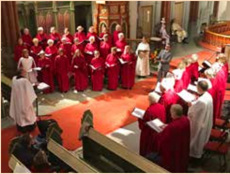
Allehelgenshøymesse og konsert