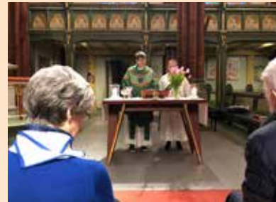
Hverdagsmesse hver tirsdag kl. 12