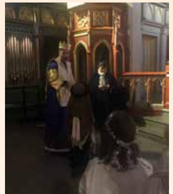
Julevandring med 1. klassinger