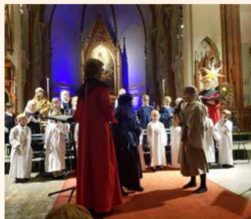
Lysmesse med Minores og aspiranter