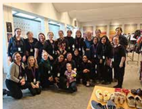
Byttefest på menighetshuset i anledning Klimafestivalen