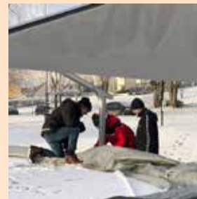
Rigging av julekrybbe