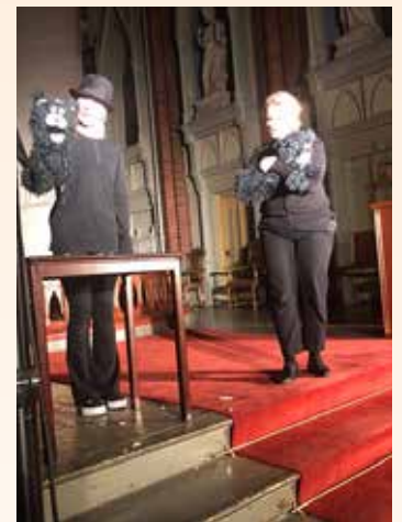
Kirkerotteteater i Bragernes kirke