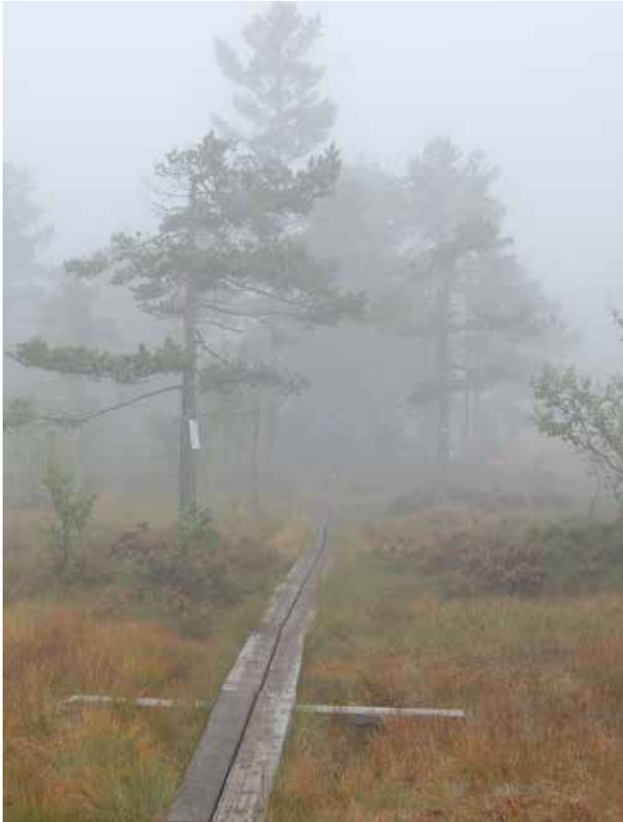
Borti her et sted ligger tjernet Skinka

2022 er frivillighetens år i Norge. Det har vært markert på mange måter over hele landet. Noe av det morsomste her i Drammen må vel ha vært 3. og 4. september i mark