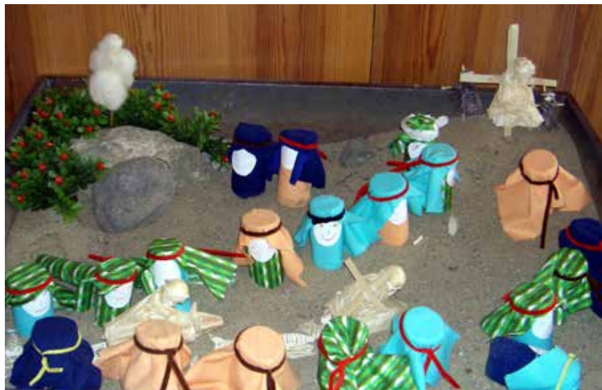
Påskehage av doruller