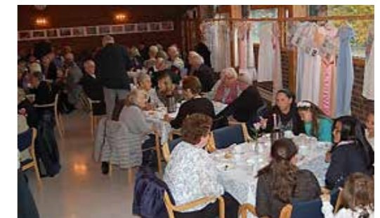
JUBILEUMSKIRKEKAFFE 1. OKTOBER.