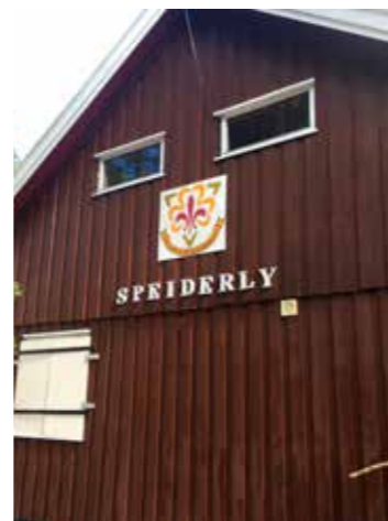
Nytt logo møter besøkende til Speiderly.