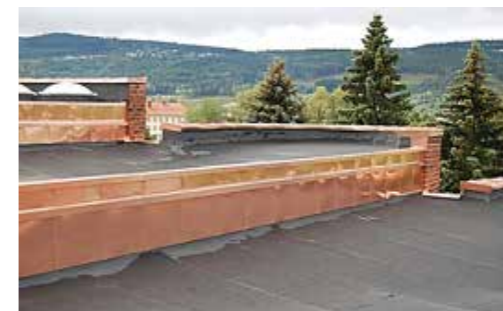
NYTT TAK MED NYTT KOBBER!

18. mars kl. 18.00 i Menighetssalen i Åssiden kirke!