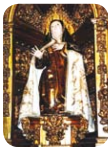
Therese av Avila

Vi bestemte oss for å avlegge et lite besøk hos prinsesse Kristina av Tunsberg si-