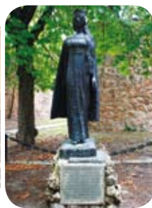
Kristina av Tunsberg i Covarrubias

den vi skulle den veien allikevel. Kristina var datter av kong Håkon Håkonson og giftet seg i 1258 med prins Don Felipe, sønn av kong Alfons X av Spania. Kristina døde svært ung og ble begravet i den lille landsbyen Covarrubias, et sted hvor hun hadde ønsket at det skulle oppføres et kapell, men som isteden ble hennes siste hvilested.