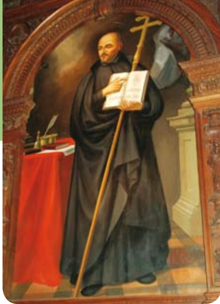
Ignatius av Loyola

La Encarnacion (Inkarnasjonen), hvor Theresa oppholdt seg mesteparten av sitt klosterliv (1535 – 1574), hvor hun hadde det hun kalte sin andre omvendelse og hvor hun utviklet den spiritualiteten som var særpreget for henne, med stillhet, meditasjon og kontemplasjon som grunnpilarene. Senere på dagen var vi også på besøk i det første klosteret Theresa grunnla etter hun reformerte karmelitterordenen, San José (St. Josefs klosteret). Der var vi også så heldige å få snakke med en av de unge nonnene, ikke ansikt til ansikt, men gjennom en liten luke som de brukte til å kommunisere med mennesker utenfor klosteret. Ellers tilbrakte de tiden innenfor klosterets murer med bønn og enkelt arbeid, uten kontakt med omverdenen, bare med unntak av noen få besøk av helt nære slektninger til begrensede tider. Utenfor klosteret var de visst bare om de måtte legges inn på sykehus eller ha annen helt nødvendig helsehjelp.