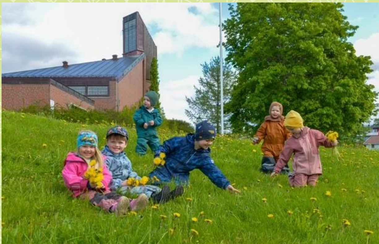
Tverlandet kirkebarnehage.