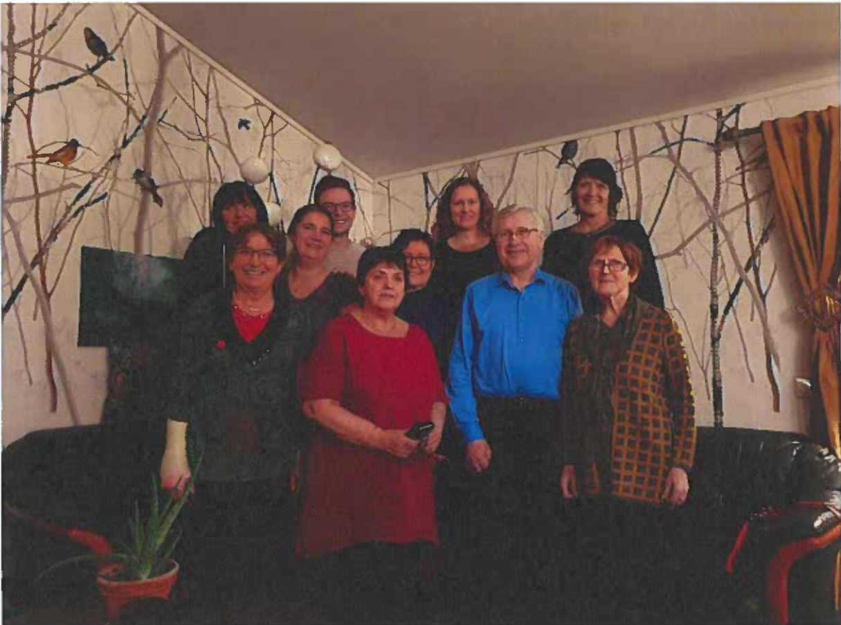
Kjerringøy menighetsråd 2019 -2023