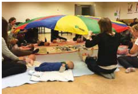
Babysang i Rønvik kirke

Nytt babysangkurs starter tirsdag 13. september. 10 ukers kurs kr 450. Vi synger gamle og nye sanger, svinger oss litt og lærer noen regler med bevegelse til. Vi avslutter sangstunden ved å bekrefte hvert barn ved døpefonten oppe i kirken og ber og tenner lys i lystennestedet. Vi avslutter hver gang med lunsj nede på det «nyombygde» kjøkkenet.