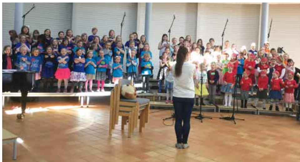
Lørdag 30. april var 100 barn samlet til barnegospelfestival i Rønvik kirke.