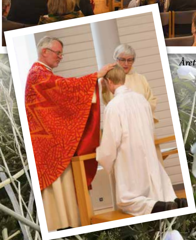
Årets konfirmasjon.