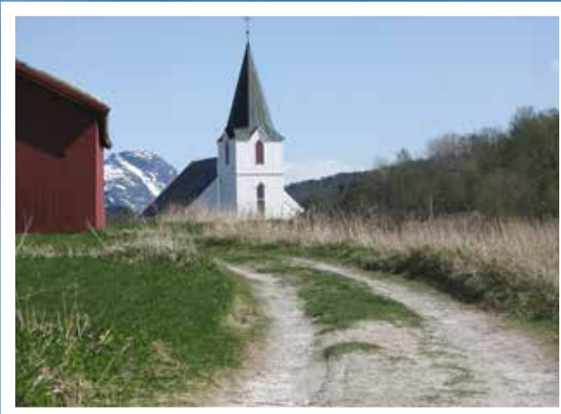
7. august blir det friluftsgudstjeneste på handelsstedet kl. 17.00. Få med dere denne hyggelige tradisjonen!