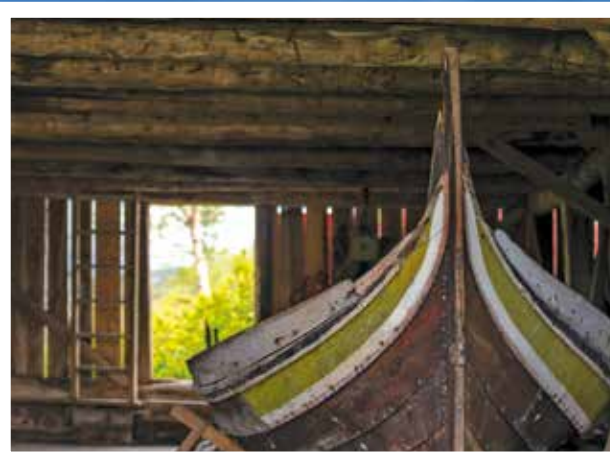
«Å gå i land på Kjerringøy den første sommar-dagen...»