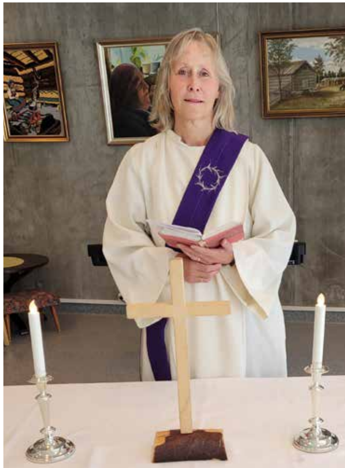
Gudstjeneste på Sølvsuper.

Jeg mener at nøkkelen til at en menighet vokser og er livskraftig er kontinuerlige tiltak/ aktiviteter. Enkeltarrangement er også viktig. Ja, takk til begge deler. Jeg er ikke en person som er veldig kreativ eller liker overraskelser. Jeg er ikke særlig impulsiv. Jeg trives best med planlagte dager. Noen er impulsive og liker nye ting, både ansatte og kirkemedlemmer. Noen er som meg, og liker best å vite hva som skal skje. Formiddagstreffet og Lekestua var der da jeg startet, så det skal jeg ikke ha æren for.