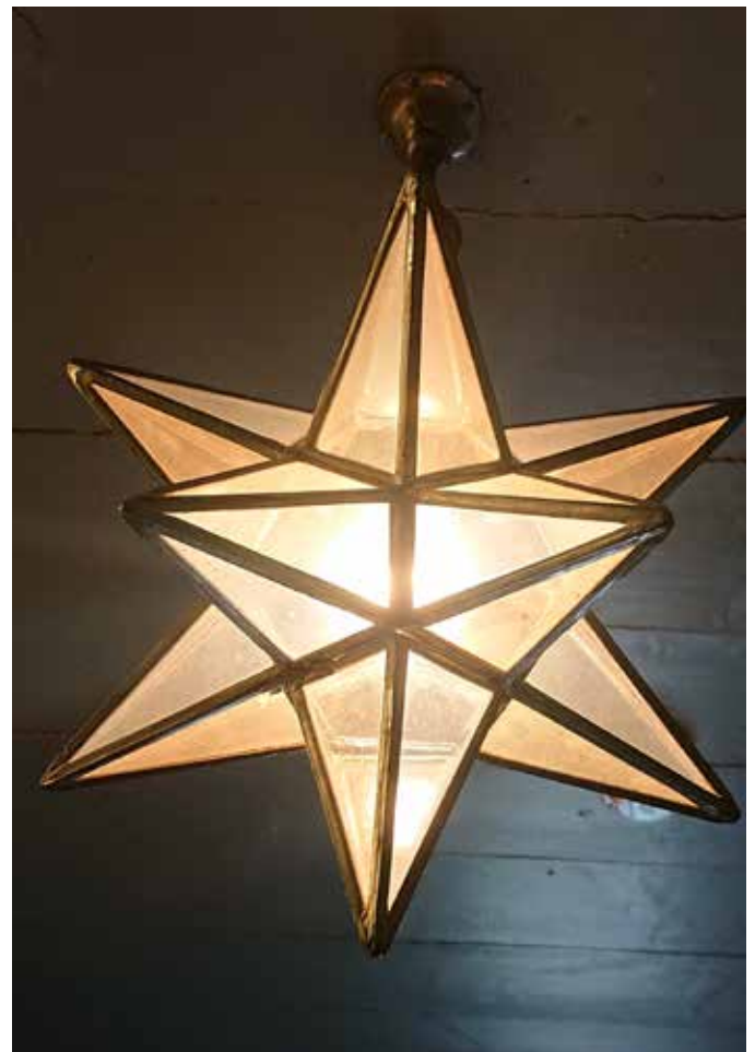
STJERNELAMPA I TAKET: Teller du stjerner inne i kirka vår, vil du komme til et tosifret resultat.

Inne i Salhus kirke vil du kunne se at det er en annen form som går igjen, blant annet på talerstol, døpefont og flere lamper. Vi er tilbake til stjerna. En kurator opplyste meg om at stjernen er et symbol som mer blir oppfattet som universelt og «kosmisk» enn direkte knyttet til kristendommen. Uansett. Teller du stjerner inne i kirka vår, vil du komme til et tosifret resultat.