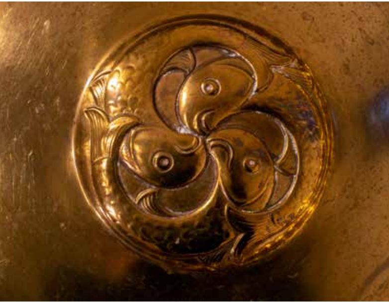
TRE FISKER I DØPEFATET: Fisken er et av de eldste kristne symboler, men den knytter også an til en helt sentral næringsvei for kystbygden Salhus.

Er du besøkende i Norges nest største by, så er sannsynligheten stor for at du rusler litt ved Lille Lungegårdsvann, Bergen sentrums stasområde. Et av de prominente byggene du vil se der, er Rasmus Meyers samlinger (reist i 1924, og i dag kjent som Kode 3). På inngangsdøra og over fasadevinduene vil du bli møtt med mengder av stjerner.