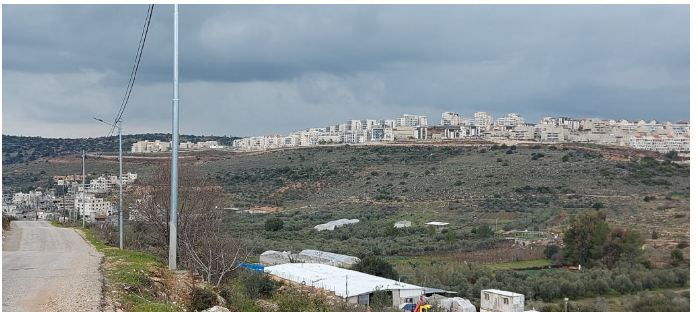
Landsbyen Wadi Fukin blir presset mellom to store bosettinger, den ene utenfor bildet til venstre

På Vestbredden, inne på palestinsk side, bor det ca 700.000 israelere i såkalte bosettinger. «Bosetting» høres jo litt hyggelig ut, men i realiteten dreier det seg om byer eller drabantbyer – de største med opptil 65.000 innbyggere. Bosettingene er gjerdet inn, og voktes strengt. Egne veier, som palestinerne ikke får bruke, fører til dem og går mellom dem. I en ring rundt Betlehem, f.eks., blir det flere og flere bosettinger, slik at den palestinske (kristne) byen Betlehem, blir omringet av det som i realiteten er en utvidelse av staten Israel, og mister sitt omland. Mange små landsbyer skvises mellom store bosettinger. Bosettingene får tilgang til vann og strøm og annen infrastruktur, mens de palestinske landsbyene får mindre.