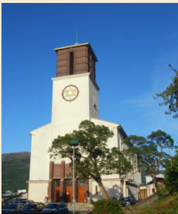
St Markus kirke Lien 45