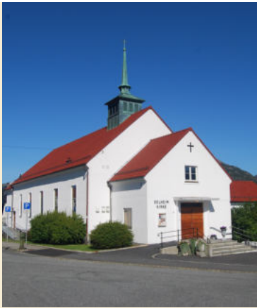
Solheim kirke Hordagaten 28