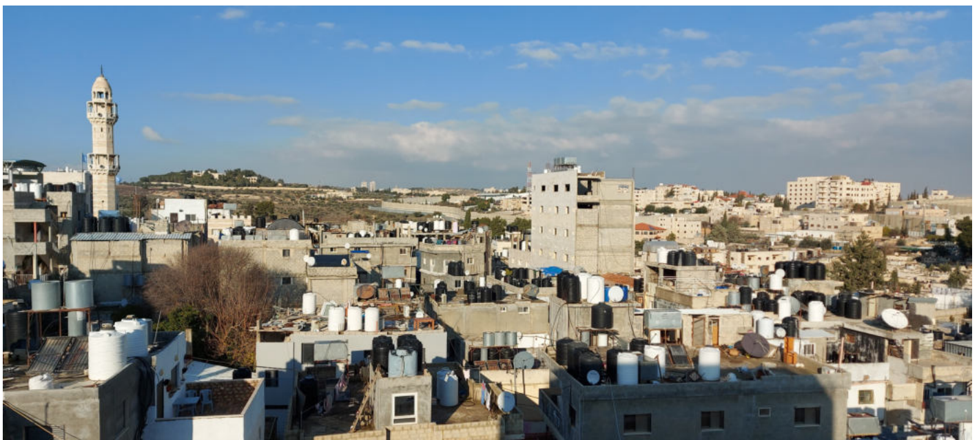
Takutsikt fra flyktningleiren Dheisheh midt i byen, med muren i bakgrunnen