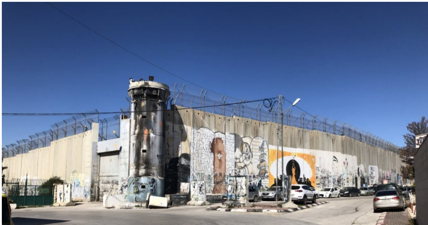
Muren, i sentrum av Betlehem

Sist vinter var jeg tre måneder i Betlehem, byen Jesus ble født i, byen fra juleevangeliet, julesangene og julekortene. Jeg var der som deltaker i et internasjonalt, kirkelig ledsager- eller observatør-program, EAPPI, «eiet» av Kirkenes Verdensråd og i Norge administrert av Kirkens Nødhjelp.