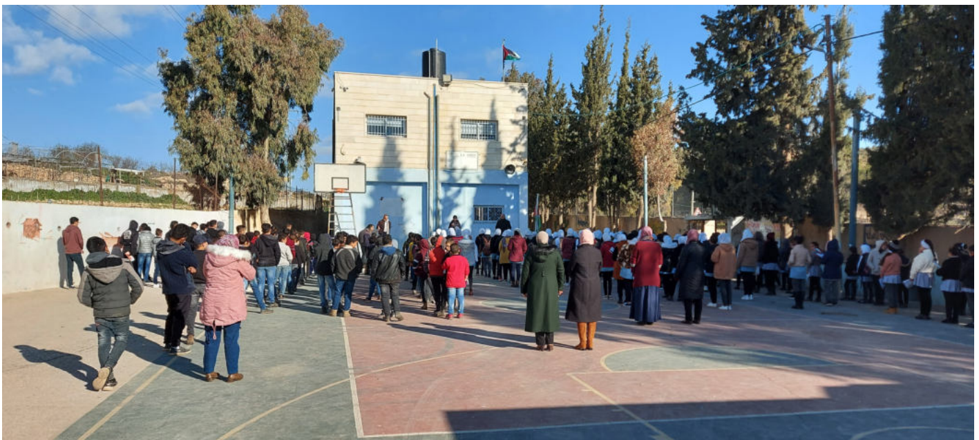
Fra skolen i landsbyen Al Minya. Hver skoledag begynner med oppstilling med informasjon, koranlesning, litt linjegymnastikk og avspilling av den palestinske nasjonalsangen

Barna blir jo vant til det, men foreldre og lærere er engstelige, og med rette. En av min EAPPI-gruppes oppgaver var, i ukens fem skoledager, å være til stede ved en del faste skoler, særlig om morgenen. Og vi opplevde selv soldater i knestående med våpnene siktet mot barn på vei hjem fra skolen, samtidig som de brukte røykgranater mot dem. Vi så soldater sperre veien for all sivil trafikk fordi en guttunge hadde kastet en stein, på trygg avstand, i retning soldatene. Ved en av «våre» skoler hadde det, like før vi kom i januar, vært en situasjon der soldater hadde slått lærere som prøvde å roe en spent situasjon utenfor en gutteskole, til blods. Utenfor en av «våre» barneskoler, stoppet en israelsk bosetter-bussjåfør og skjøt med et håndvåpen. Han hevdet at barna – altså på en barneskole – var bevæpnet.