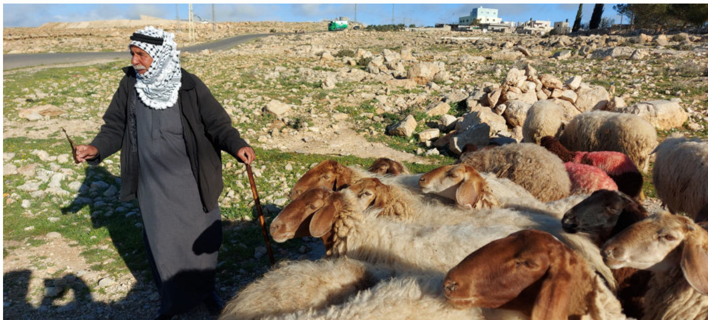
Fremdeles passer hyrder sauene på markene i landsbyene rundt Betlehem

Etter at vi hadde vært på grensepasseringen, var vi altså på skoler når elevene kom, og deretter besøkte vi gjerne landsbyer hvor vi traff bønder og gjetere, lokale ledere eller «vanlige folk». Det er også flere flyktningleirer i Betlehem, som vi hadde kontakter i og med. De tre andre på mitt lag var kvinner, og de fikk god kontakt med kvinnegrupper – i Midtøsten er ikke det like enkelt for en mann.