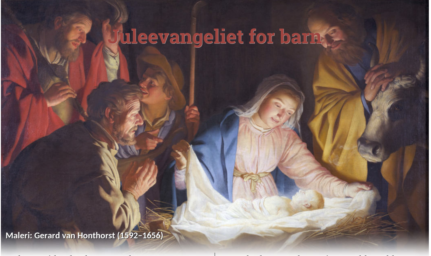
Maleri: Gerard van Honthorst (1592-1656)

For lenge siden levde en som het Augustus. Han var keiser, en slags konge som er sjef over andre konger. Augustus bestemte at alle voksne menn i riket hans skulle telles.