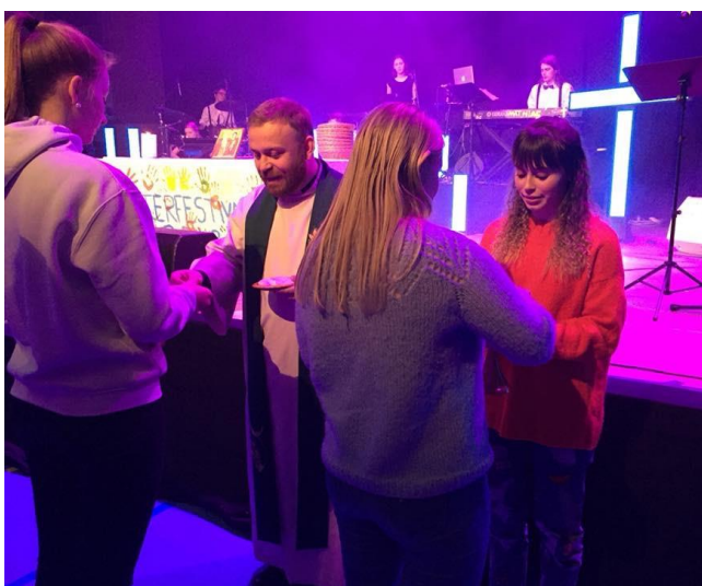
Gospelnight i Ytrebygda kirke

Det er gudstjeneste så å si på alle søn- og helligdager i soknet, bortsett fra andre påskedag og andre pinsedag – og søndag før jul, hvis den er nær julehøytiden. En søndag i måneden er gudstjenestene i Ytrebygda på kveldstid. Disse er tilrettelagt for utviklingshemmede – og det er klubbsamling for beboere i bofellesskap i forkant av gudstjenestene. På alle disse