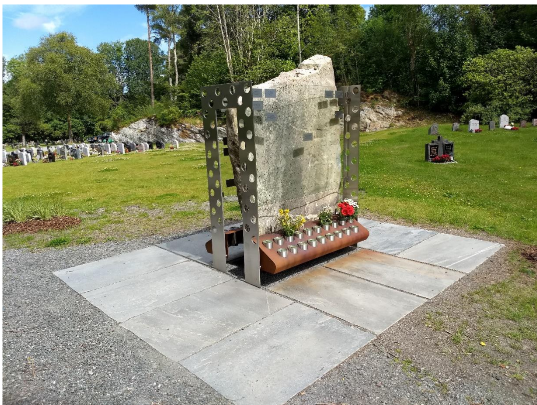
Minnesmerke på den navnete minnelunden på Fana kirkegård sommeren 2018

Den navnete minnelunden på Fana kirkegård ble åpnet i februar 2017. Den dekker et økende behov når det gjelder flere muligheter for valg av gravleggingsform. Navnet minnelund er et gravfelt med urnegraver som er tilknyttet et felles minnesmerke med plass for navneplater med navn på de som er gravlagt i minnelunden. Fana fikk Bergens andre minnelund og det første året, ble over 30 graver tatt i bruk i navnet minnelund. Ut fra historiske tall tilsvarer det rundt halvparten av urnenedsettelse i nye graver på Fana kirkegård. Ved første gravlegging i navnet minnelund er det mulig å reservere en grav mot betaling av festeavgift for denne graven i 20 år. Navneplaten står på minnesmerket i 20 år og det gis anledning til å feste graver etter de første 20 årene.