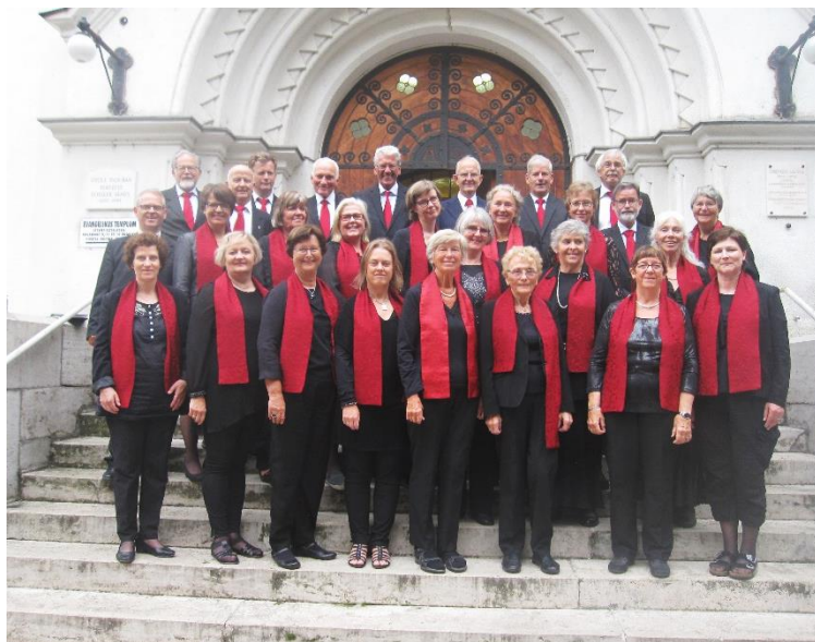
Fana kyrkjeor på tur

Fana menighet har et rikt musikkliv med tiltak for alle aldre. De fleste tiltakene er enheter som primært blir drevet av frivillige med støtte fra de tilsette. Staben har en barne- og ungdoms-musiker og to kantorer som alle er involvert i mer eller mindre grad. De fleste enhetene er knyttet enten til KFUK/KFUM eller Kirkesangforbundet/Ung kirkesang. Alle musikalske tiltak i soknet er en del av menighetenes musikalske uttrykk, både i gudstjenester og andre samlinger.