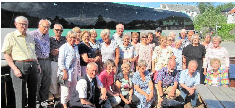
Seniortreffet på tur

kirkelig fellesskap både som ansatte i fremtiden, men ikke minst som ledere og deltagere på kirkens fellesskapsarenaer. Derfor er vi tett på ungdommene så langt det lar seg gjøre. Vi prioriterer å være tilstede som ansatte og voksne på arrangement sammen med ungdommene. I tillegg er det viktig for oss å involvere ungdommene i arbeidet gjennom reell påvirkning og gjennom ansvar. Det er kjekt å se at ungdomsarbeidet i Fana sokn gjennom mange år har rekruttert til alle deler av kirkens virke, og ikke minst at Ten-Sing rekrutterer kirkemusikere.