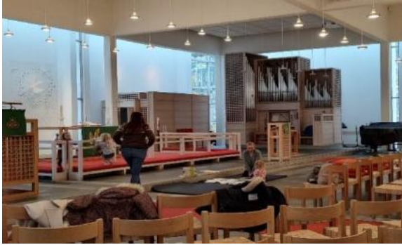
Ill. foto 2023

bevegelser til fem-tegns-bønnen som barna deltok med på gudstjenesten. 27 barn deltok på førjulssamling.