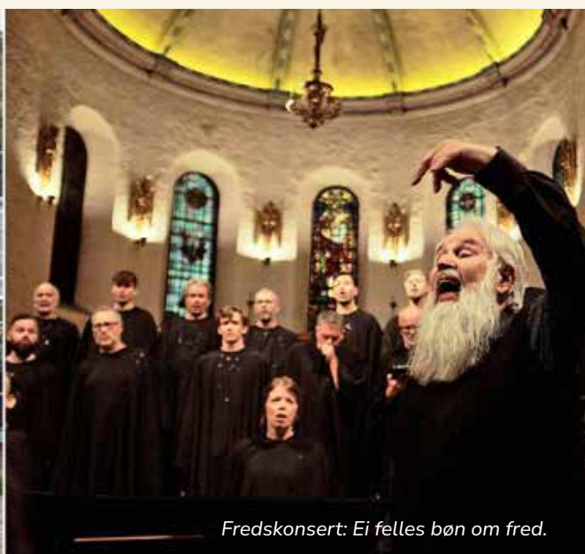
Fredskonsert: Ei felles bøn om fred.