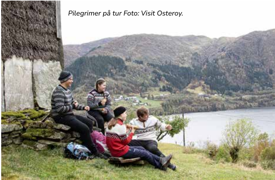
Pilegrimer på tur

Pilegrimsvandring er en urgammel praksis. Allerede i oldkirken reiste kristne til steder knyttet til Jesu og martyrenes liv. I Norge ble tradisjonen særlig knyttet til Olav den hellige og hans grav i Nidaros. Etter reformasjonen i 1536/37 ble pilegrimsvandring nærmest avskaffet i Norge, og Olavsskrinet i Nidaros ødelagt. Men tradisjonen levde videre i folkeminnet, og har fått en sterk gjenoppblomstring de siste tiårene.