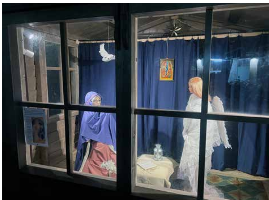
Fra utstillingen Maria budskapsdag.

TEKST OG FOTO: ANNE-LISE MISJE OG KRISTINE BECH-SØRENSEN