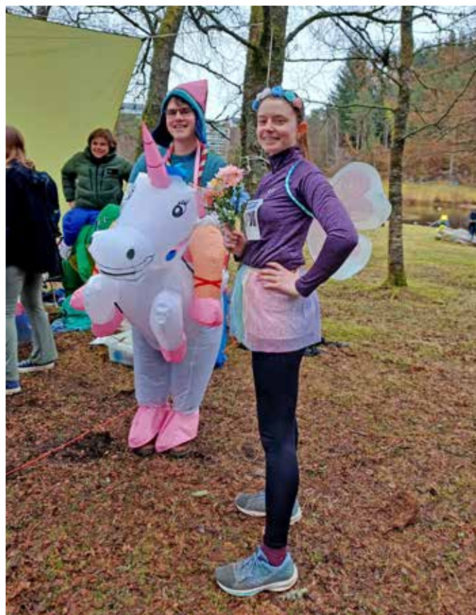
Det var premier for beste utkledding også.

Takk til K/M-speidergruppene i Åsane for en strålende solidaritetsinnsats! Det ble samlet inn til sammen 25 000 kroner.