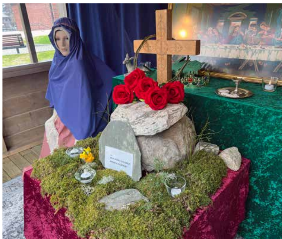
Fra utstillingen i påsketiden..