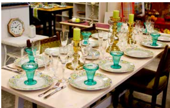
FERDIG DEKKET FESTBORD: Denne butikkutstillingen får tydelig frem at du ikke trenger å la tusenlappene fly dersom du trenger noe nytt og lekkert til festbordet.