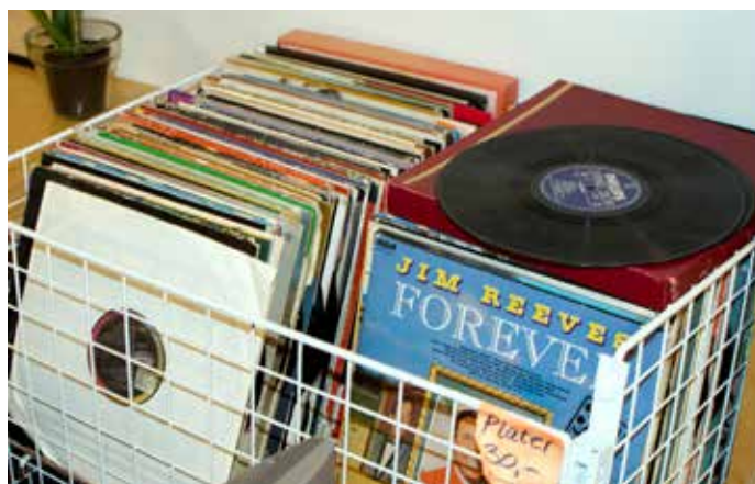
SVART GULL: Gamle vinylplater er både sjarmerende og kan inneholde ukjente skatter for musikkfrelste.