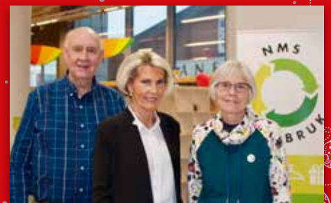
Miljø, misjon og møteplass