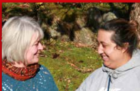
Ein velsigna venskap