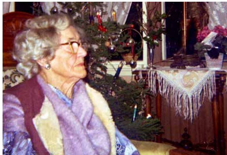
JULEFEIRING MED MORMOR: For barn er alt så selvfølgelig, men i ettertid har jeg ofte tenkt på de tusen tingene som skal til for å få alt perfekt og ferdig i tide. Min mormor var en flink husmor.