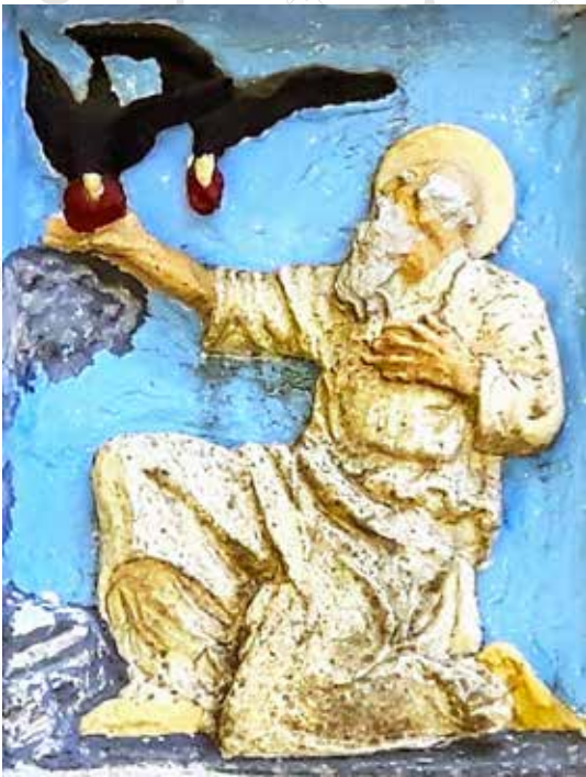
MERKELEGE TING HENDE: Profeten Elia fekk mat frå to ramnar som kom til han då han var på flukt frå kongen, her i ein utandørs dekorasjon frå ei ortodoks kyrkje på Rhodos.

bad til sin gud om at han måtte sende eld som kunne tenne bålet. Bønene deira og guden deira vart spotta av profeten. Dei kom ingen veg.