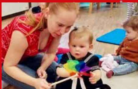
Jubileumsfest i Noa barnehage