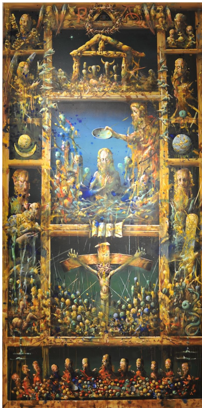
Altartavle i Fridalen kirke, malt av Håkon Gullvåg, 2020