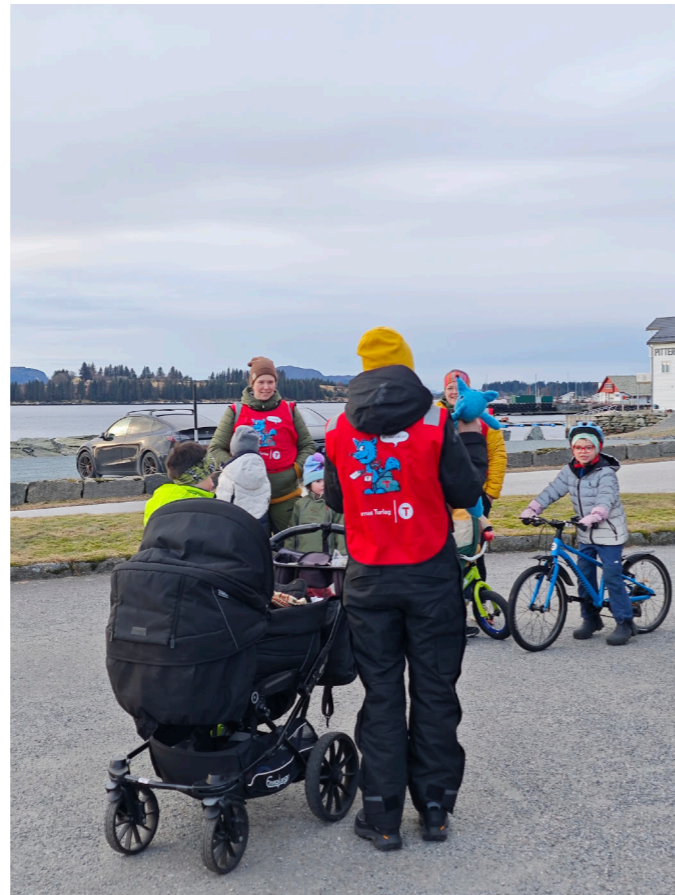
Store og små er også klare for tur Prestegarden rundt!

Om nokon som var med på eit eller fleire av arrangementa på Barnefestivalen har forslag, tips eller idèar til kjekke ting vi kan finne på til neste år, kan dåke gjerne kontakte meg. Vi blir taknemleg for det.