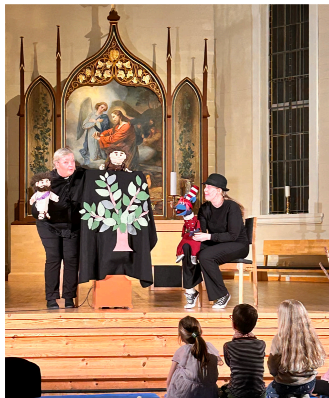
Kirkerottene kom på besøk til borna i Askvoll også i år, og koste seg på Barnefestivalen.

På søndag kveld fekk vi besøk av Kirkerottene som kom til oss med forteljinga om Viggo i tårnet. Det var stas.