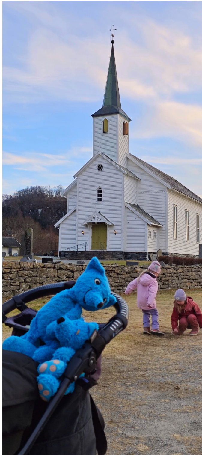
Turborevene er klare for tur!