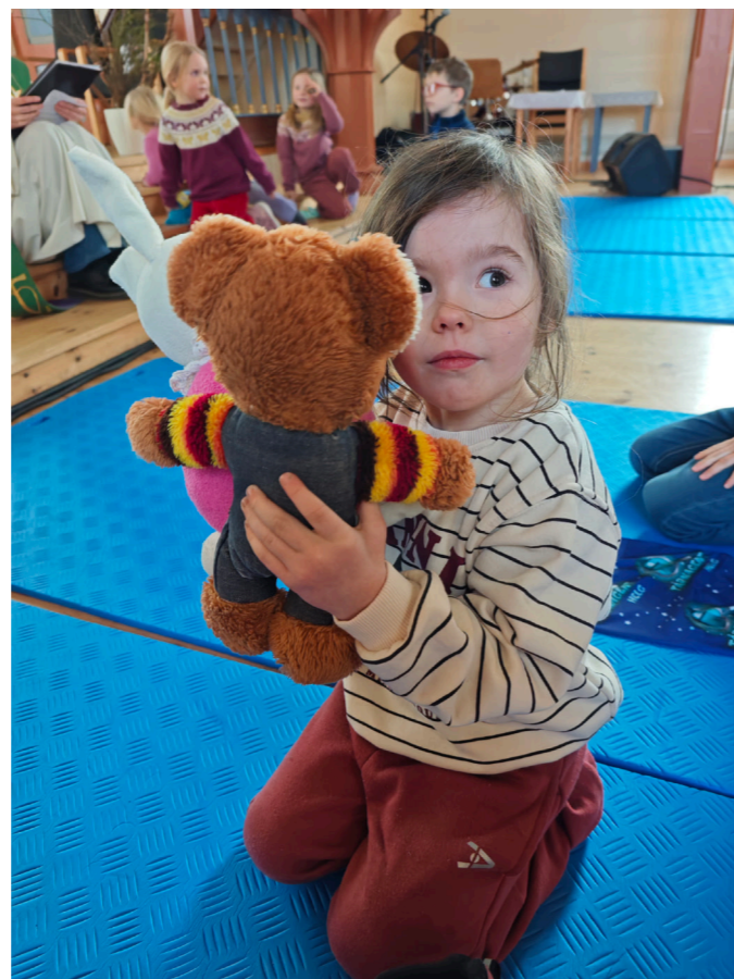
Det er fint å ha med bamse i kyrkja