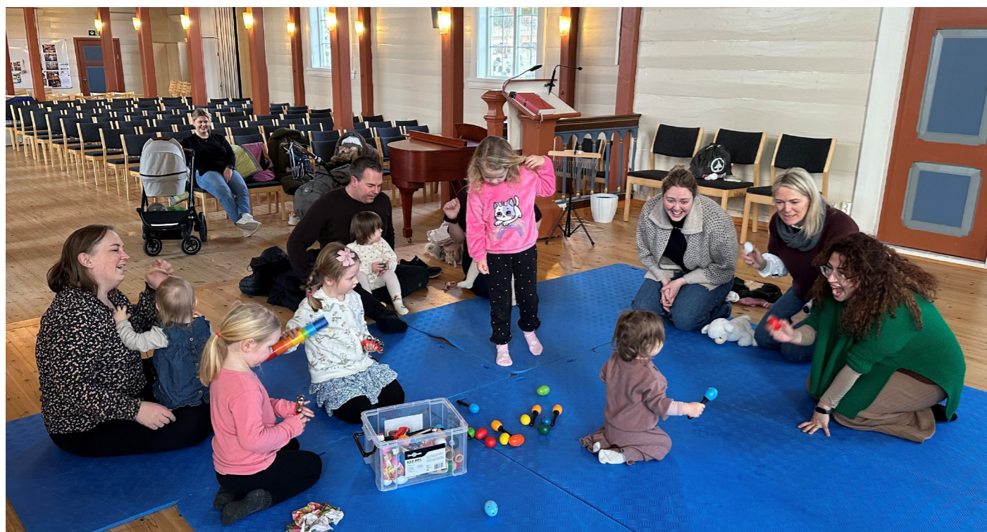
Dei minste skulle hente dåpsduer på Duesleppet, og dei var flinke til å ta med seg større søsken, foreldre og besteforeldre.

I år var det barnefestival for heile soknet 7. - 9. februar med forskjellige tiltak for forskjellige aldersgrupper. Det var veldig kjekke dagar med mange kjekke born «på besøk».