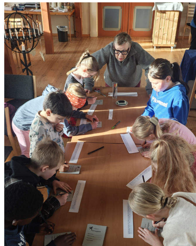
Tårnagentene lagar ID-kort med runealfabetet og fingeravtrykk!