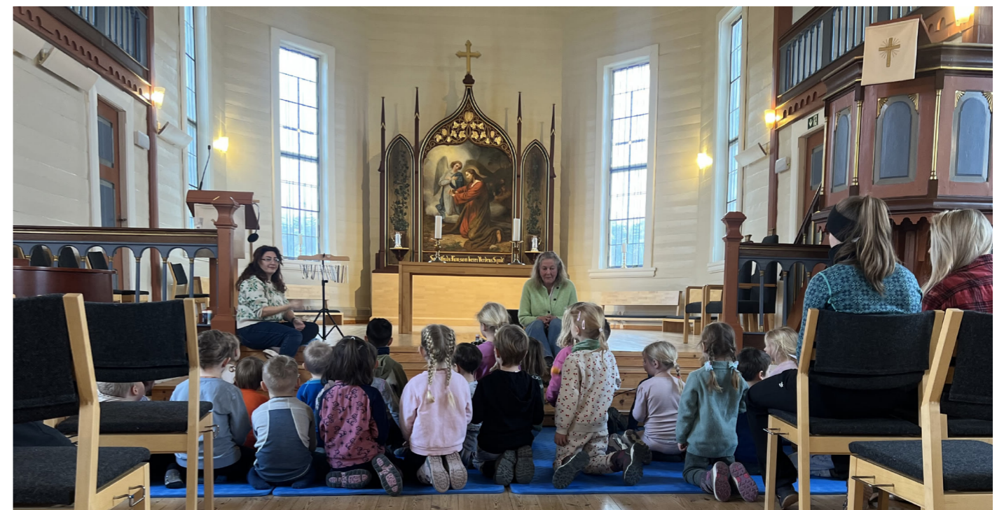
Det var både Småtroll-Trall og Stortroll-Sprell med song, leik og rytme for borna i Røverompa barnehage.