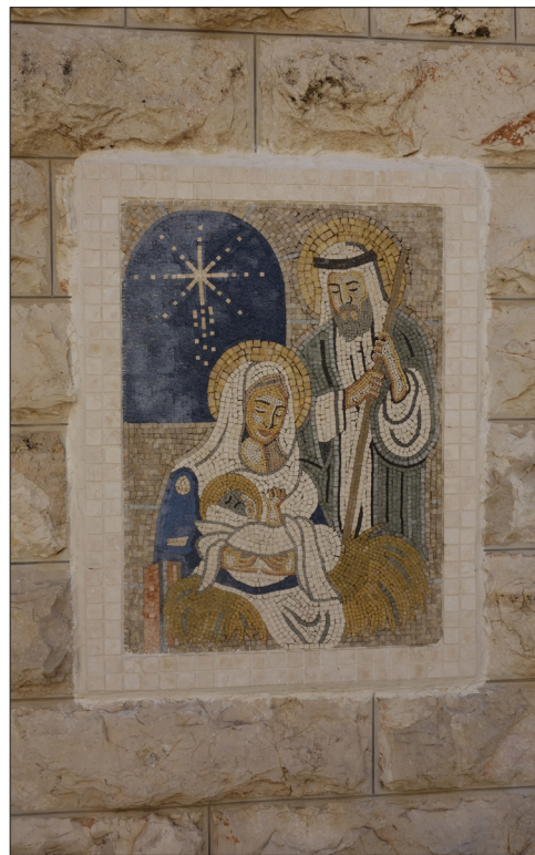
JULEMOSAIKK. Den lutherske kirken i Beit Sahour ligger bare et steinkast fra Betlehems-markene. Ved inngangen, blir menigheten møtt av en utendørs veggmosaikk med julenattens motiv.