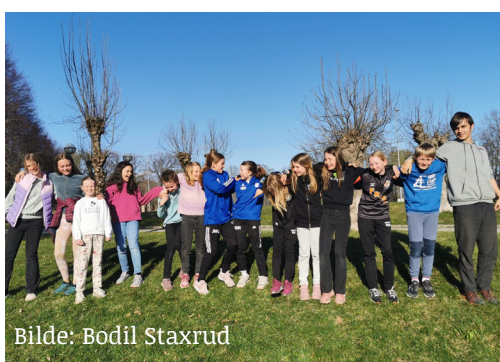
Bilde: Bodil Staxrud