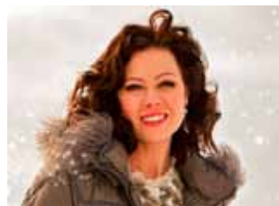
Trine Rein.

I fjor startet et spennende og fruktbart samarbeid mellom Trine Rein og lokale Soul Children- og Soul Teens-chor. Det ble til 11 julekonserter i kirker rundt på Østlandet.