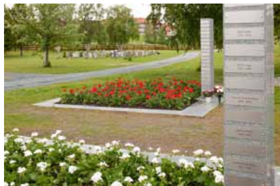
Navnet minnelund ved Moholt kirkegård i Trondheim. Monumentet i forgrunnen viser hvordan navneskilt kan plasseres. Ved monumentet i bakgrunnen har besøkende satt ned blomsterbuketter.