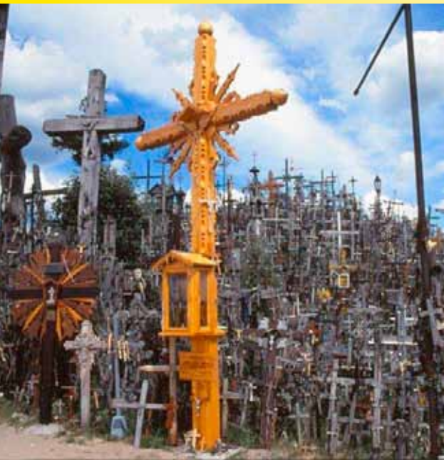
På veien mellom Vilnius og Riga ligger Korshøyden. Tusener av trekors er plassert her siden 1400-tallet.