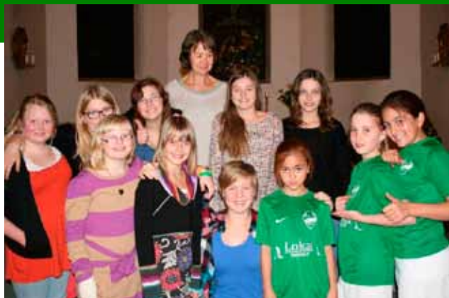
Ås Soul Children på korøvelse i Ås kirke 06.11.