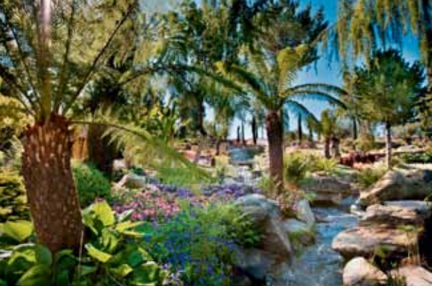
Flor og Fjære på Palmekysten i Ryfylke, landet der klimaendringene alt er overstått!