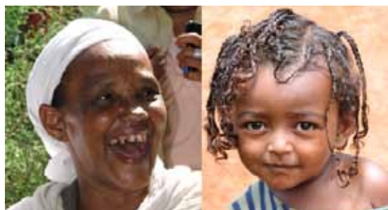
Små og store har fått det bedre i Wollega, takket være støtte fra Norge.