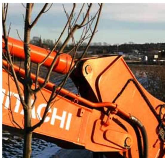
Forrige oppgave: Det stod i alle fall en gravemaskin ensom og forlatt langs Drøbakveien ved Treider, opp for Korsegården. Ås kirke er synlig i bakgrunnen.