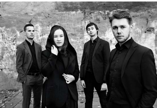
Opus 13.