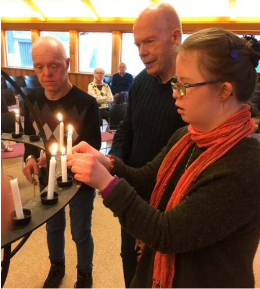
Tro og lys-samling.