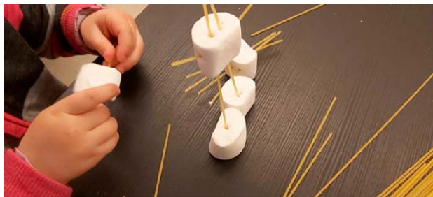
På Baluba er det en fin blanding av sang og aktiviteter for de minste.