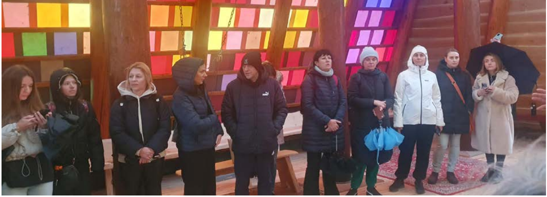
Flyktninger i Håpets katedral.