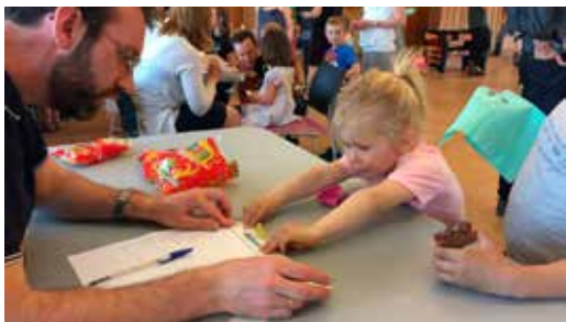
Strekking av seigmann krever at utøveren tøyer seg langt for å nå et høyt nivå.

Årets siste familiefredag gikk av stabelen 5. mai. Godt over 80 personer var samlet til taco-middag og tivoli. Kveldens rekord i seigmannstrekking ble 28 cm. Du kan prøve hjemme om du klarer bedre! Det ble også satt dugelige rekorder i limbodansing, ballongløp og vannfrakting, det ble lakket negler og malt fjes, det ble vunnet premier på tombola og kastet ball i bøtte. Og innimellom sklei det ned litt kake og kaffe/saft. En hyggelig ettermiddag, både for barna og for de voksne. Vi ser fram til flere familiefredager til høsten!