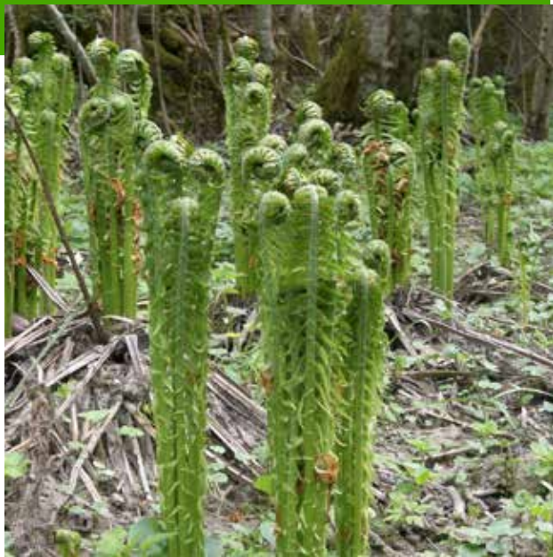
Å se noe vokse og folde seg ut ...

Vi slapper av i naturen. Forskning viser at natur reduserer stress. Forklaringen kan være at naturomgivelser oppleves som estetisk gode å være i. Dermed blir vi mindre anspente og stressnivået synker. Andre eksperimenter viser at når vi er slitne i hodet etter å ha jobbet lenge med en oppgave, henter vi oss raskere inn igjen i omgivelser med mye natur. Vi lar oss fascinere av detaljer og sammenhenger. Oppmerksomheten flyttes fra de oppgavene som krever mye av oss, til omgivelser hvor vi ikke må konsentrere oss på samme måte.