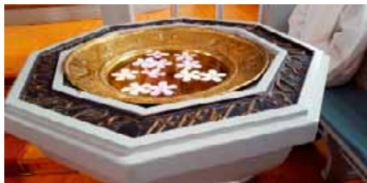
Manna-blomster: Små sammenbrettede papirlapper ble lagt i døpefonten der de fløt på vannet. Etter litt sprang de ut som blomster og et bibelvers kom til syne. Barna plukket dem opp.