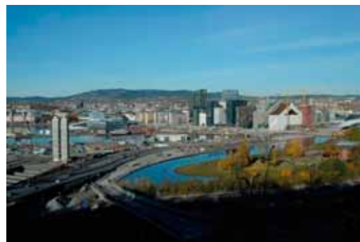
Utsikt fra Ekeberg