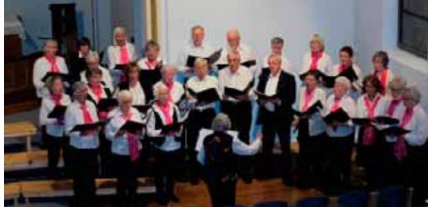
Ås Seniorkor i Ås kirke.