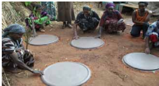
Aniya (t.v.) gir opplæring til nabokvinner. Foran dem ser du de nye takkene.