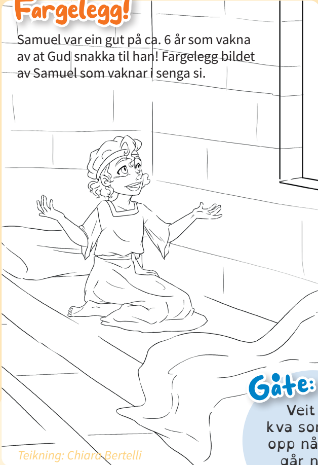
Teikning: Chiara Bertelli

Samuel var ein gut på ca. 6 år som vakna av at Gud snakka til han! Fargelegg bildet av Samuel som vaknar i senga si.