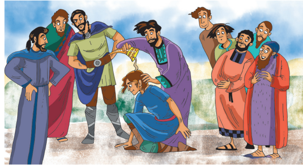
Teikning: Kari Sortland

Samuel hørde mange ting frå Gud. Då Samuel blei vaksen fortalde Gud han kven som skulle bli konge. Kan du finne fem feil på bildet under?