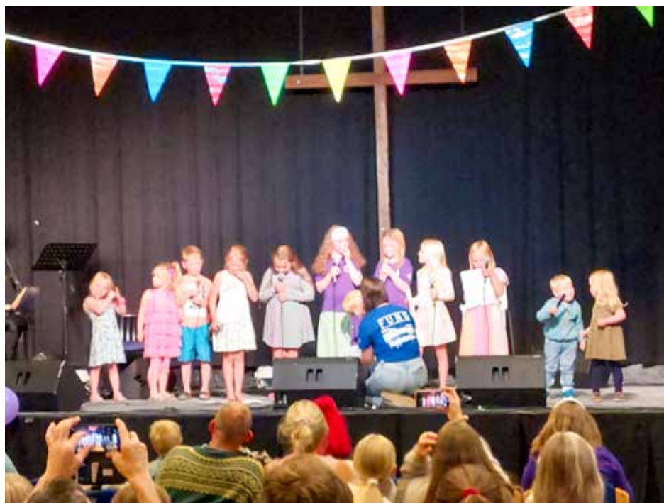
Fra Barnefestivalen siste uka

Takk for en flott bibelcamping nok et år!